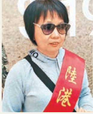
■李小姐狠批上月連串發生的「反水貨客」損港形象。