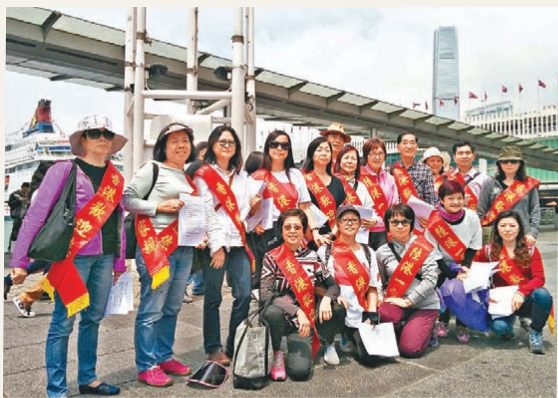
■由網民自發組織的「陸港一家親」昨日齊集尖沙咀歡迎內地遊客。

同時,旅發局亦會在今年6月中至8月中推出「香港Fun享夏日禮」,透過推出購物優惠及電子折扣券吸引旅客,以及於短途市場為活動進行推廣。曾俊華期望相關活動能加強不同市場旅客來港旅遊的興趣,令本地旅遊、零售、餐飲、酒店、運輸等行業能夠受惠,穩住本地就業市場。