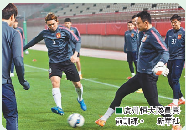
■廣州恆大隊員賽前訓練。新華社