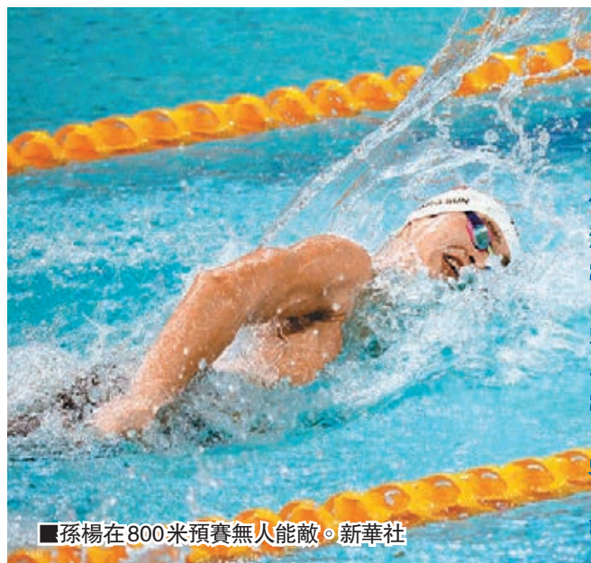
■孫楊在800米預賽無人能敵。

全國游泳冠軍賽暨喀山世錦賽選拔賽昨繼續在陝西寶雞進行。奧運冠軍孫楊雙線出擊,先在上午進行的800米自由泳預賽輕鬆獲得第一名,其後在男子200米自由泳決賽以1分45秒75奪冠,並創下該項目今年世界最佳成績。不過,倫敦奧運200米混合泳冠軍葉詩文,則在副項200米自由泳預賽名列第25,無緣準決賽。