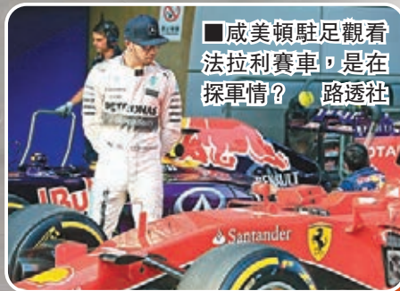
■威美頓駐足觀看法拉利賽車,是在探軍情?