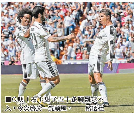
■C朗(右)射了五十多腳罰球不入，今次終於一洗頹風。

皇家馬德里昨晚西班牙甲組足球聯賽第31輪主場迎戰伊巴前，仍然被搶走自己領頭王座的巴塞羅那帶開4分。經新年後一輪低潮近兩戰重新爆發的葡萄牙球王C·朗拿度，相隔1年後是役終於射入罰球，皇馬結果淨勝伊巴3：0，輕鬆袋3分。