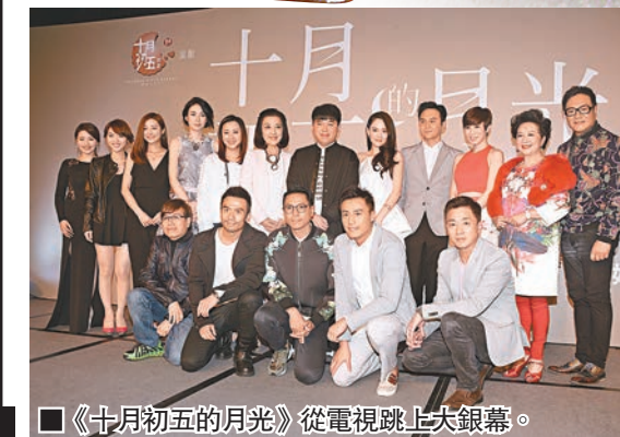
《十月初五的月光》從電視跳上大銀幕。