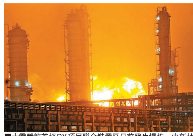
■古雷騰龍芳烴PX項目聯合裝置區日前發生爆炸。中新社

「中國對PX的國際購買量非常大，但是中國一點話語權都沒有。」行業分析師表示。事故發生後，有廠商向安迅思分析師表示擔憂，「日韓地區的PX會不會大量湧入國內，我還在觀望。」作為PX下游的PTA企業表示，「未來中國或許只能眼睜睜看着國外PX廠商賺錢，這個是沒辦法的事情。」