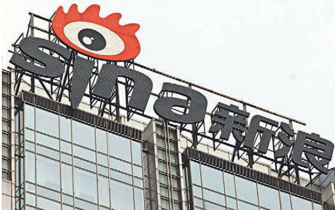
■新浪因屢遭舉報被網信辦要求整改。

報道指，經查實，新浪網讀書頻道提供的20部在線閱讀互聯網作品，經鑑定為宣揚淫穢作品。另經核實，新浪公司在其開辦的新浪網視頻節目中，登載了4部色情互聯網視聽節目。同時，執法部門還查證，新浪網存在未按許可證載明事項從事互聯網視聽節目服務的違法違規行為。此後，新浪公司通過官方微博「新浪科技」發布致歉聲明。