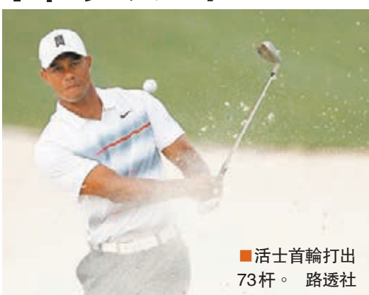
活士首輪打出73杆。

傷癒復出的「老虎」活士首輪打出高標準杆1杆的73杆，並列第41位。賽後活士表示滿意自己的表現，仍將力爭奪冠：「我的感覺很好，今天的開球很好，應該足夠讓自己打到「-3」的成