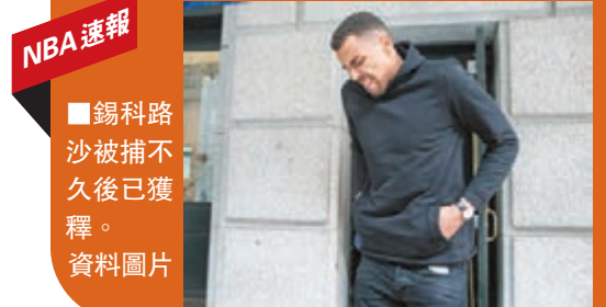
錫科路沙被捕不久後已獲釋。資料圖片