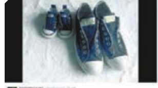
瑪莉絲蒙在twitter宣布有喜。網上圖片

瑪莉絲蒙在2006年贏得澳網和溫網兩項大滿貫錦標，2009年退役，現為英國男網球手梅利的教練，同時是法國聯合會盃隊長，現在這名前一姐有喜，預料對梅利的訓練工作以及法國備戰聯盃造成一定影響。