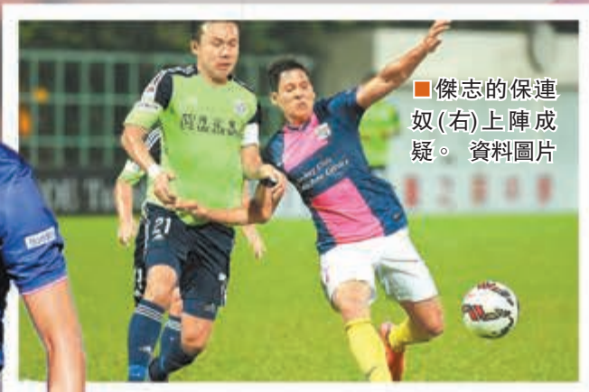
傑志的保連奴(右)上陣成疑。