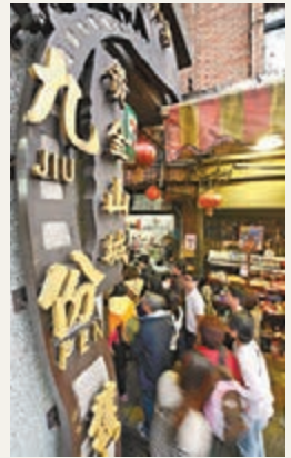
台灣九份老街。 資料圖片

Google統計來自台灣以外的全球網友，透過Google街景服務搜尋台灣地區景點的資訊，並依照搜尋次數排出前10名，其中搜尋量最多的是九份老街。而台灣人出境游玩之前，也要上網做功課，台灣網友最愛搜尋的前10名當中，第1名是日本青森的弘前公園。