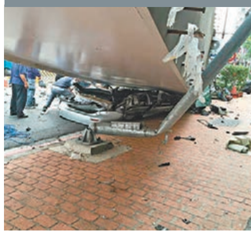
台中捷運掉鋼樑，多人受傷。

香港文匯報訊 據中通社報道，台中市捷運綠線工程昨日傍晚發生鋼樑墜落事故，晚間搶救結束時統計，共造成4人死亡、4人受傷。