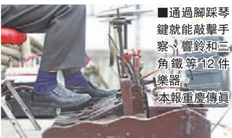
通過腳踏琴鍵就能敲擊手琴、響鈴和三角鐵等12件樂器。

習，師從著名二胡教育家蔣鳳芝先生。事實上，文華春在重慶已是一位頗有名氣的草根藝人，在2011年的《中國達人秀》舞台上，他用同時演奏15件樂器的技能震驚全場，也讓國外的華文媒體開始關注他。