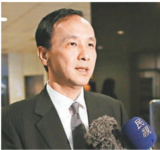
「國共論壇」將於5月3日在上海舉行，國民黨方面是否由朱立倫率團出席尚未確定。 資料圖片

他表示，距離2016尚有半年之久，藍營也還沒提名參選人的情況下，「習朱會」不應和選舉直接掛鉤。但由於此前兩黨高層交流，不是由「副總統」蕭萬長、吳敦義以民間身份出席，就是由前主席吳伯雄代為會晤。如果此次由國民黨黨主席本人率團，以大陸常說的「見面三分情」來說，「起碼在兩黨互信的傳承上還是有一定的特殊意涵」。