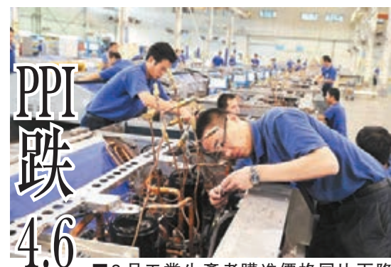
■3月工業生產者購進價格同比下降4.6%。圖為河北一企業忙碌的生產車間。資料圖片

香港文匯報訊(記者 海巖 北京報道)國家統計局昨日公佈,3月全國工業生產者出廠價格(PPI)同比下降4.6%,降幅比2月份收窄0.2個百分點,是2014年7月以來首次收窄。專家預計,未來PPI降幅將呈現逐月收窄態勢。