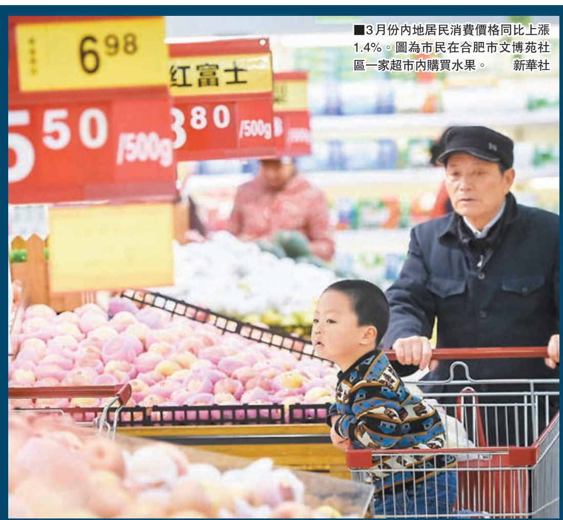
■3月份內地居民消費價格同比上漲1.4%。圖為市民在合肥市文苑社區一家超市內購買水果。

對於未來貨幣政策走向,專家普遍認為,物價維持在低谷,反映經濟疲軟需求不足的局面仍未改觀,為後續貨幣政策進一步放鬆提供了政策空間,降息、降準的概率比較大。