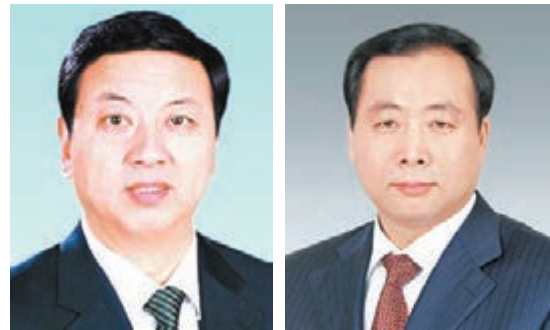
■馮新柱 本報西安傳真 ■姜鋒 本報西安傳真

香港文匯報訊(記者 張任珍 西安報道)陝西省人大常委會昨日召開第18次會議,任命馮新柱、姜鋒為陝西省副省長,並接受江澤林、白阿瑩辭去陝西省副省長的請求。據了解,馮新柱此前任陝西省銅川市委書記,姜鋒此前任陝西省咸陽市委書記。