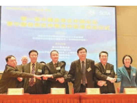
■中國自由貿易試驗區仲裁合作聯盟昨日成立。

在昨日下午的第一屆中國自貿區仲裁論壇上,有關的自貿區仲裁機構舉行了簽約儀式。據介紹,中國自貿區仲裁合作聯盟是由上海國際經濟貿易仲裁委員會(上海國際仲裁中心)、天津仲裁委員會、福州仲裁委員會、華南國際經濟貿易仲裁委員會(深圳國際仲裁院)、珠海仲裁委員會、南沙國際仲裁中心聯合發起的自貿區仲裁合作機構。其宗旨是聯合各仲裁機構探討交流自貿區仲裁業務創新,聯合舉辦中國自貿區