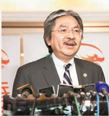
曾俊華認為,現時市場波動較大、風險高,呼籲市民入市要小心。

香港文匯報訊(記者 倪夢環 上海報道) 香港財政司司長曾俊華昨於滬港經貿合作協議結束後表示,近期香港股市市場熾熱,而滬港通亦為港股向上作出了貢獻。未來,滬港通額或可上升,但具體時間不能確定。不過,他提醒,雖然近期行情很好,但由於市場波動大,風險高,市民入市需多加小心。