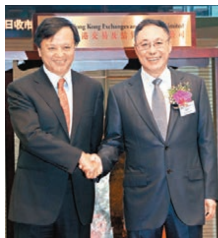
李小加(左)呼籲投資者冷靜入市。圖為李小加出席廣發證券上市儀式。

李小加又重申,滬港通是長遠的政策,不是設計來讓人「搵快錢」的,是為使中國居民財富海外多元化發展而設計及建造。往後內地股市對本港市場的影響愈來愈大,香港投資者需建立冷靜的投資風險意識。