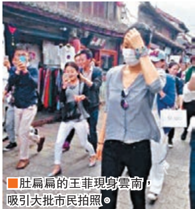
肚扁扁的王菲現身雲南,吸引大批市民拍照。

自從王菲同謝霆鋒復合之後,近日更有傳出王菲有咗,昨日有網民在雲南大理見到王菲。只見戴住口罩,紮起頭髮的阿菲,同埋囡囡李嫣去一間首飾舖,相中見到阿菲身形都幾瘦,完全唔似係有咗。因為好多市民追住阿菲狂影,搞到阿菲要急急離開,不過佢越跑就越吸引多人追住影。