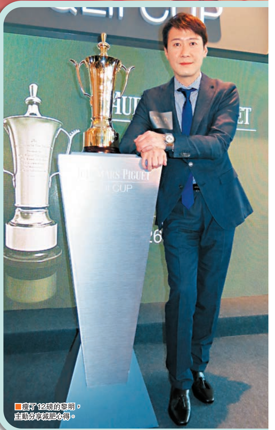
瘦了12磅的黎明,主動分享減肥心得。