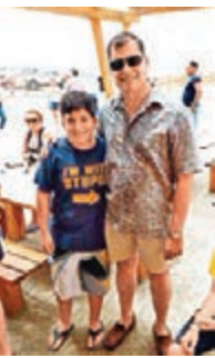
■男童T恤上寫着「我正與蠢人一起」。

不少政要和明星為顯親民，通常不會抗拒合照要求，不過也應小心挑選對象。厄瓜多爾總統科雷亞早前應一名年輕支持者要求合照，卻沒留意到對方的T恤上竟寫有「我正與蠢人一起」，T恤上的箭嘴更直指科雷亞。合照隨即在網上瘋傳，有網民笑稱該男童「可能是美國中情局(CIA)派來，意圖顛覆厄國政府」。 ■《每日電訊報》