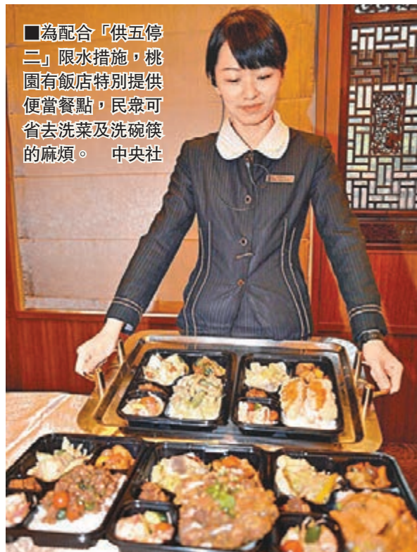
為配合「供五停二」限水措施，桃園有飯店特別提供便當餐點，民衆可省去洗菜及洗碗筷的麻煩。中央社

凱昌環境公司水車林姓司機說，自前日開始限水，訂單又增加五成；水車以載送距離計價，每車約1萬至1.5萬，沒有趁機漲價。