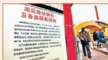
朝陽公園南門售票處旁貼着「婚紗攝影收費標準」。

前日下午，朝陽公園內一對新人正在拍婚紗照，攝影師說，「這裡的大草坪和西洋建築拍起來效果不錯。」至於200元的服務費，他表示，肯定是新人來掏。