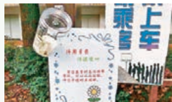
株洲現「待用車費零錢站」。

網友「@靜聽花落」說，「待用車費」在外地已經有先例，但在株洲可能還是第一次，「這個舉動不僅有助於喚醒人與人之間