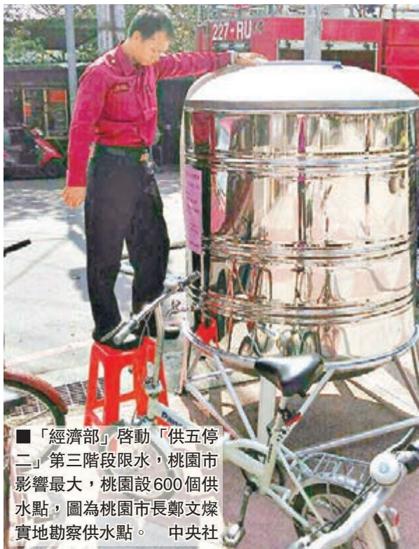
「經濟部」啓動「供五停二」第三階段限水，桃園市影響最大，桃園設600個供水點，圖為桃園市長鄭文燦實地勘察供水點。

桃園市大園的集盛化學說，前日清晨5時載第一趟，一天至少要載四趟、共40噸水，才夠工廠清洗機台的用水量。