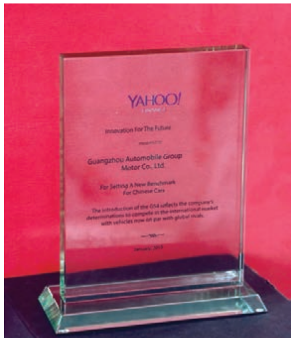
廣汽傳祺「Innovation For The Future」(創新未來獎)獎盃。

傳祺不僅樹立了中國汽車的新基準，還以全球領跑者的姿態，以創新驅動發展，引領自主品牌走出去，開創新時代。傳祺引領的自主品牌正加快實施「走出去」戰略，並且在國際競爭中逐漸發展壯大，中國誕生世界級汽車品牌更是指日可待。