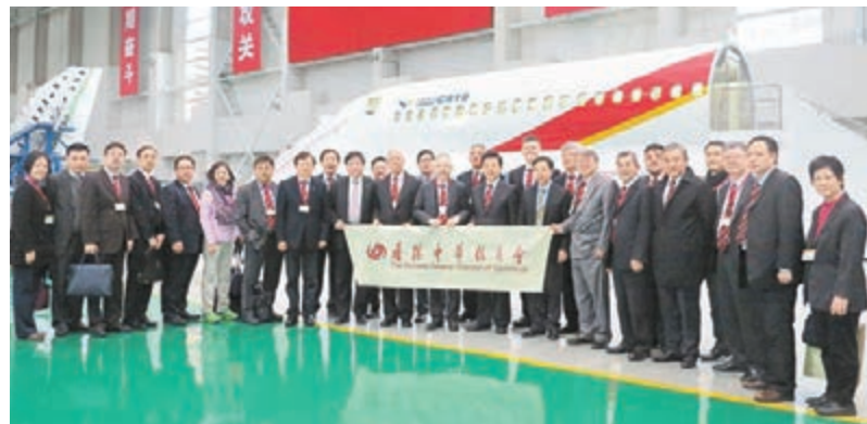
團員參觀中國商用飛機公司。