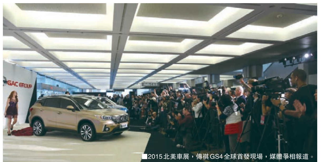
2015北美車展，傳祺GS4全球首發現場，媒體爭相報道。