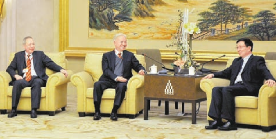
韓正書記(右)與中總楊釗會長(中)、李德麟副會長交流滬港合作新機遇。

他說，上海將在2020年基本建設國際金融、貿易、航運、經濟「四個中心」，當前正全力推進有關工作，並正驅動發展戰略，推動建設科技創新中心，而香港在人才集聚、市場機制等方面有許多優勢，希望滬港一如以往加強合作，分享經驗、相互促進，實現共同發展。他並介紹了上海自貿區的建設情況，包括在自貿區擴大範圍後，進一步擴大開放貿易服務業、航運服務業、專業服務業等領域，將對金融制度創新等內容進一步細化，歡迎香港企業家共同參與自貿試驗區建設。