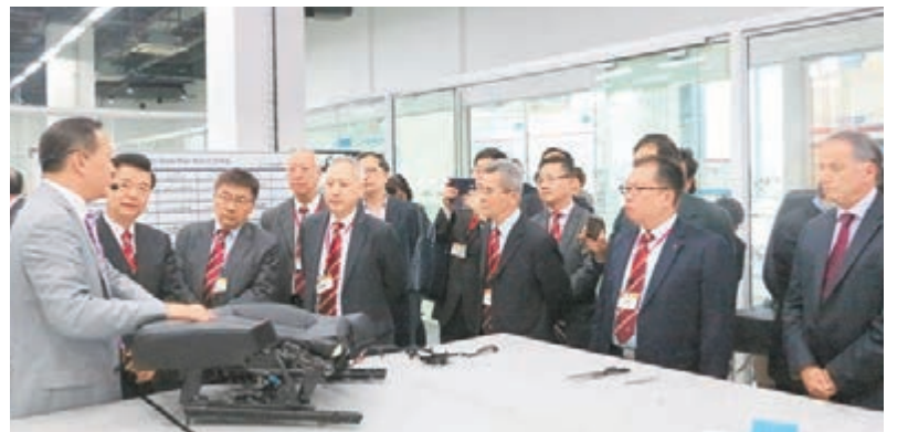
考察團參觀閔行區內的汽車座椅生產商。