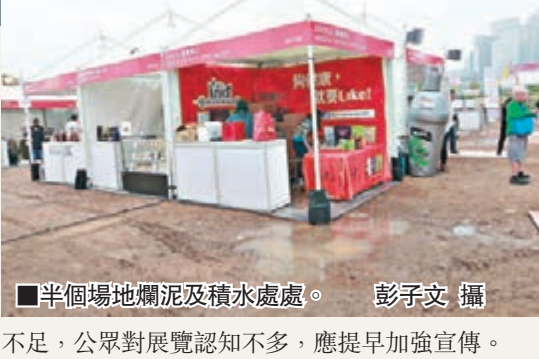
半個場地爛泥及積水處處。

中泥濘，橫街通道更完全沒有鋪設木板。於橫街設攤位的意酒坊有限公司負責人Simon投訴主辦單位安排失當，未有提供適當協助，唯有自行找紙皮鋪於爛泥上，直至黃昏6時，主辦單位才鋪設木板。Simon說：「原本話係草地，點知係泥地！啲客見到寧願避過唔行入嚟！而且個頂漏水，紙皮箱濕晒，要擺晒貨出嚟！好彩唔影響你的品質。」他又批評主辦單位宣傳不足，「我身邊朋友都唔知有呢個活動，我同主辦單位講過應該兩個月前開始做宣傳，但佢哋無。」參展商漢科電腦公司的攤檔同樣處於爛地上，但由於臨近入口，主辦單位早已鋪設木板，負責人Lawrance表示，正與主辦單位商議更好安排，「個位始終對正門口，如果換成較偏僻的位置，就未必換。」另一參展商Lab Made分子雪糕專門店的攤檔幸而設於磚地上，但負責人亦認為是次展覽宣傳