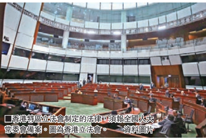
香港特區立法會制定的法律，須報全國人大常委會備案。圖為香港立法會。

問：香港特區的法律由誰制定？ 答：香港特別行政區享有立法權。具體法律由香港特區立法機關——立法會制定。（基本法第十七條）