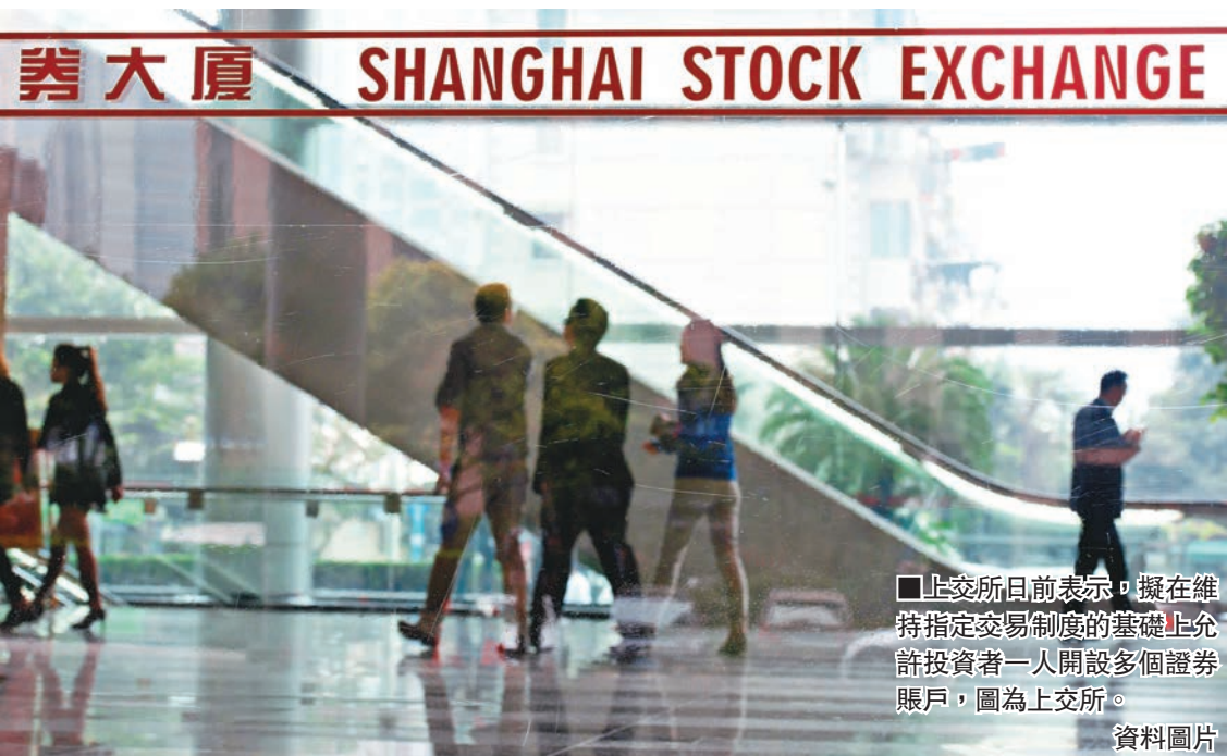
■上交所日前表示，擬在維持指定交易制度的基礎上允許投資者一人開設多個證券賬戶，圖為上交所。

一人多戶不僅方便了投資者，着力發展互聯網證券業務的券商同樣受益。中新社引述安信證券研報