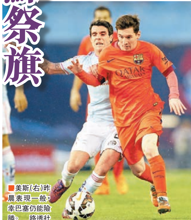
美斯（右）昨晨表現一般，幸巴塞仍能險勝。