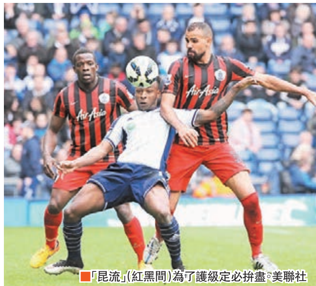
「昆流」（紅黑間）為了護級定必拚盡。

近一年一度有力爭前4位的阿士東維拉，如今竟要為護級而奮鬥，實在令人意外，始終打了31場聯賽但只贏得7場，勝出場次連10場都沒有，難與中游相比。目前維拉以7勝7和17負積28分排第17位，較尾3的般尼僅多2分，基於分數接近的還有侯城（28分）和新特蘭（29分），維拉的護級道路仍算漫長，當然形勢稍比只有25分的「昆流」有利。