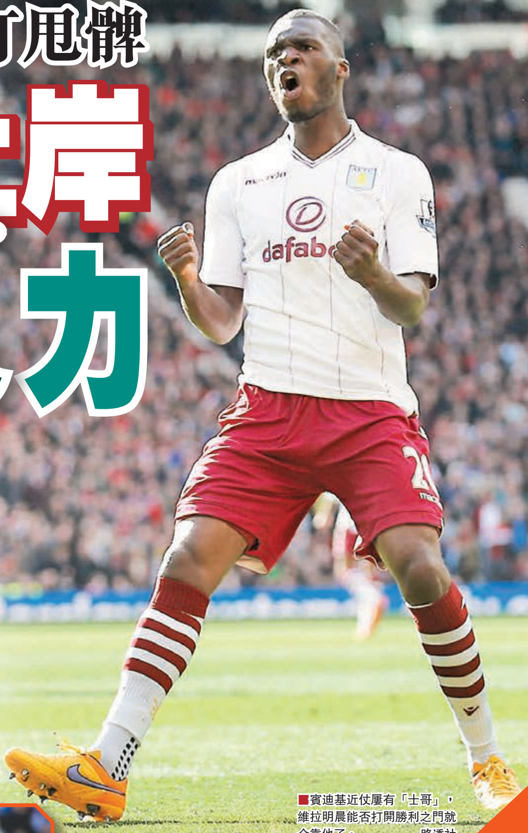
賓迪基近仗屢有「士哥」，維拉明晨能否打開勝利之門就全靠他了。