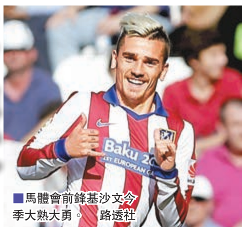
馬體會前鋒基沙文今季大熱大勇。

基本上奪冠無望的馬德里體育會（馬體會），即使無力衛冕西甲，但不等於要放軟手腳，因現排第3位的他們要面對第4、5位華倫西亞與西維爾的威脅，領先優勢僅1分及4分下，剩餘9場賽事絕不可掉以輕心，否則隨時會被兩隊趕過，無緣明年再戰歐聯。