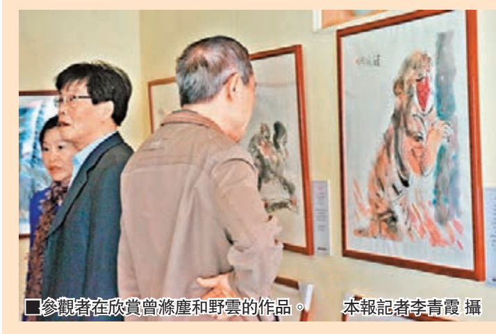
■參觀者在欣賞曾濂塵和野雲的作品。