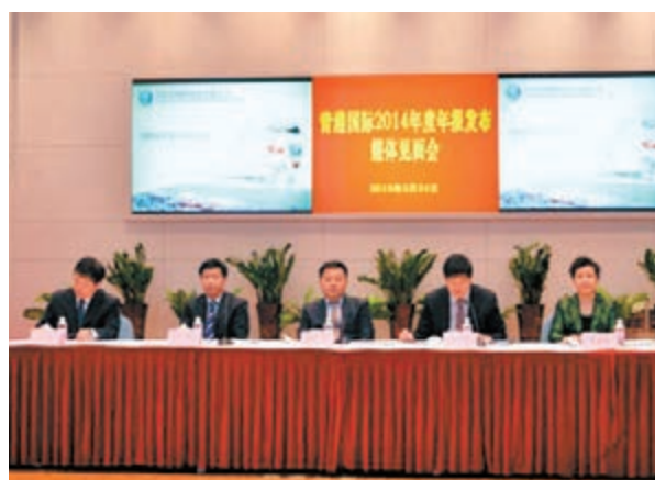
■青港國際2014年度發布會現場。

香港文匯報訊(記者 許桂麗、實習記者 楊艷翠 青島報道)青島港(6198)集團旗下主要營運商青港國際早前發布了自2014年6月轉型上市後的第一份年度業績公告,並召開了媒體發布會。