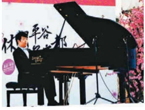
郎朗為北京平谷桃花音樂節開幕式演奏。

香港文匯報訊(記者 楊凌雲 北京報導)第十七屆北京平谷國際桃花音樂節在國家4A級景區金海湖昨日舉行盛大開幕式。據介紹,本屆桃花音樂節以「休閒平谷 桃花之都」為主題,將持續至下月6日結束。開幕式上,平谷區政府正式宣佈代表北京申辦2020年世界休閒大會,並將以申辦世界休閒大會為契機,大力發展休閒旅遊產業。據悉,此申辦意向已獲國務院批准。