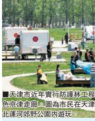
天津市近年實行防護林工程,搭建綠色京津走廊。圖為市民在天津市武清區北運河郊野公園內遊玩。

香港文匯報訊(記者 達明 天津報導)地處京津走廊中部的天津市武清區,今年規劃造林10萬畝,植樹629萬株,佔全市造林面積的近20%,使全區林地總面積達近百萬畝,林木覆蓋率達到37%,居全市平原區縣前列,為京津地區生態建設和空氣質量提高進一步發揮出「綠肺」功能。