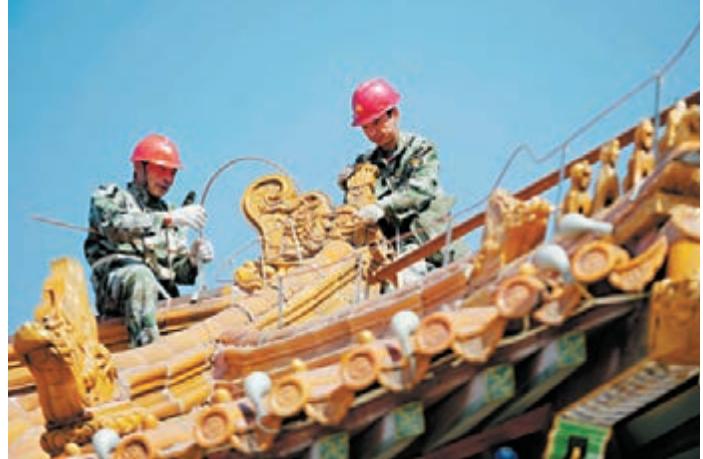
遼寧避雷工程 世界文化遺產——遼寧瀋陽昭陵避雷工程昨日正式啟動,工程為期三個月。施工人員將為瀋陽昭陵內古建築更換紫銅材料防雷帶。同時將設置170多處新型接地裝置,可將雷電更好地導入地下。

香港文匯報訊(記者 楊毅 重慶報導)2015年中國·豐都廟會將於本月21日舉行。主題是「逛豐都廟會·覽『鬼城』民俗·祈幸福安康」。廟會期間,活動分佛事活動、文藝活動、商貿活動三大板塊。佛事活動包括講經法會、延生普佛等活動;文藝活動包括文藝演出、街頭巡遊、「遊輪母港之夜·魔幻焰火秀」、民間收藏品展示交流等活動;商貿活動包括萬人牛肉火鍋宴、台灣美食(商品展)暨民俗文化會展等。