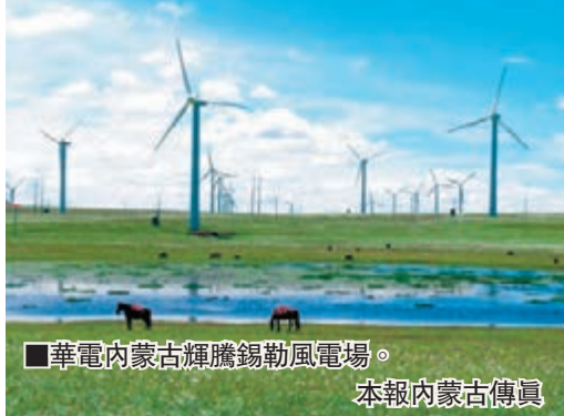
華電內蒙古輝騰錫勒風電場。

香港文匯報訊(記者 張鵬宇 內蒙古報導)日前,內蒙古政府辦公廳發佈《關於建立可再生能源保障性收購長效機制的指導意見》,明確提出2015年全區可再生能源上網電量佔全社會用電量達到15%,到2020年達到20%。其中,2015年風電和光伏發電限電率分別控制在15%和6%以內,將可緩解風電併網的難題。具體額度分配到發電企業和電網公司,完成情況將作為考核電網公司負責人的重要指標。 對於可再生能源的發展,內蒙古實行總量控制,制定可再生能源年度發電量計劃指標。按照規定,蒙西地區風電年平均利用小時數不低於2,000小時,光伏發電不低於1,500小時。蒙東地區風電年平均利用小時數不低於1,800小時,光伏發電不低於1,400小時。而接入同一區域的風電場棄風率和太陽能電站棄光率超過標準要求的,本區域不得新增併網風電場和太陽能電站,待緩解達到要求後,再考慮新上風電場和太陽能電站。 此外,《指導意見》鼓勵風電等可再生能源開展供熱試點項目,電網公司對參與供熱的風電場原則上不限電。