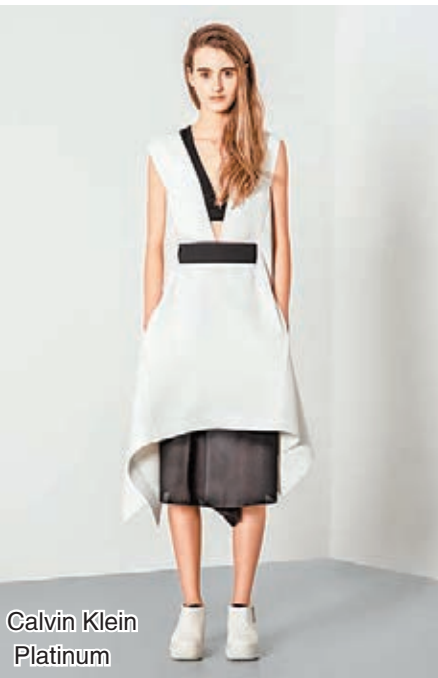
Calvin Klein Platinum