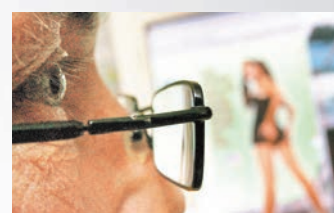
■色情報復事件最常發生在社交網站。資料圖片 一旦發布即屬違規。twitter亦作出同樣修訂，用戶若觸犯規定，將被要求刪除圖像才能繼續使用，若違規會被封鎖帳戶。

Fb上月中修訂裸露內容發布政策，首次明言禁止色情報復，並例明「任何圖像以報復目的分享，或未經相中人同意」。