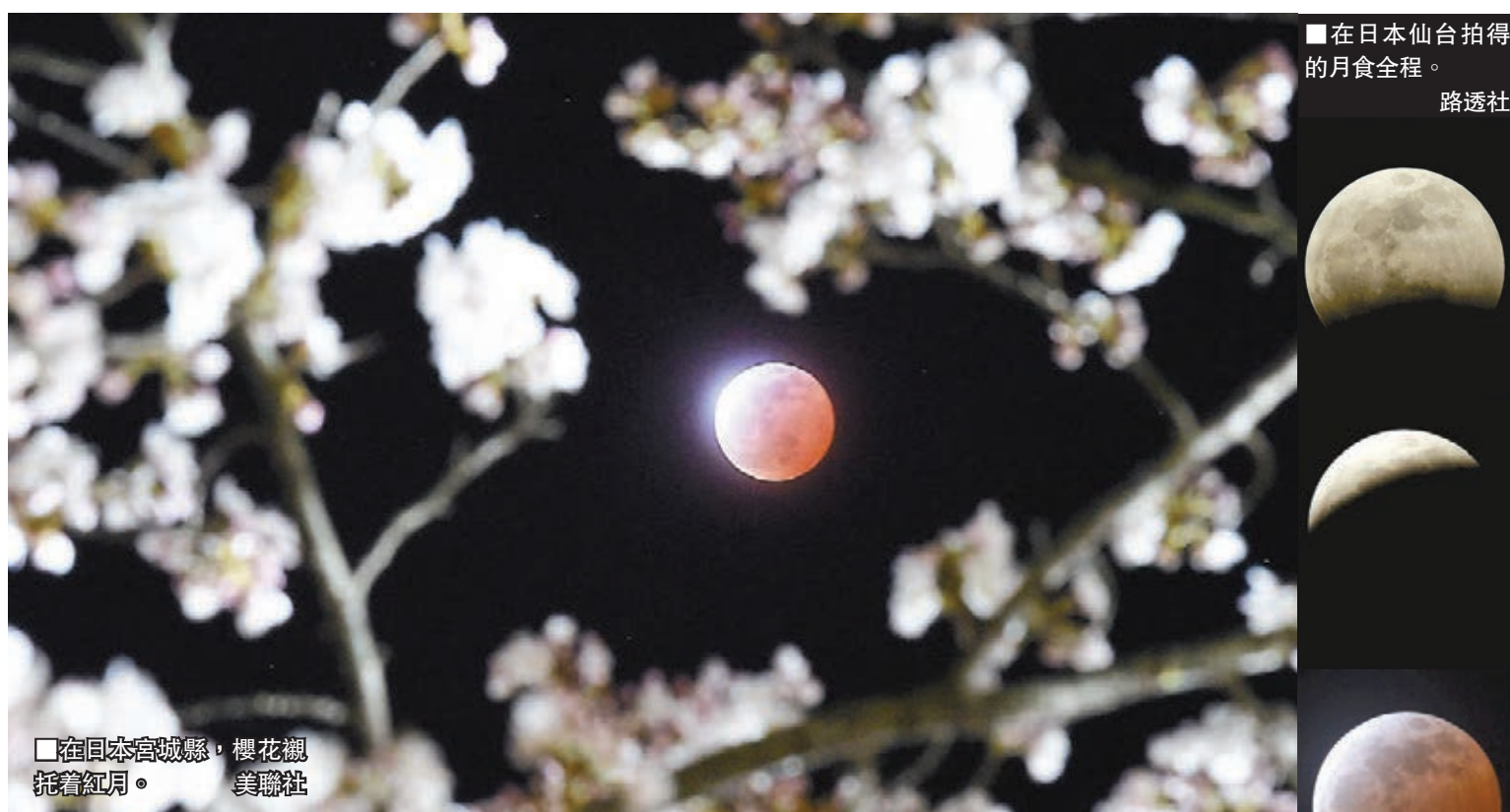
■在日本宮城縣，櫻花襯托着紅月。