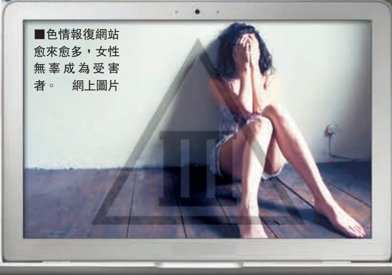
■色情報復網站愈來愈多，女性無辜成為受害者。網上圖片