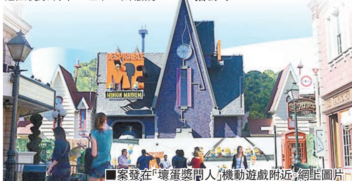
■案發在「壞蛋獎門人」機動遊戲附近。網上圖片