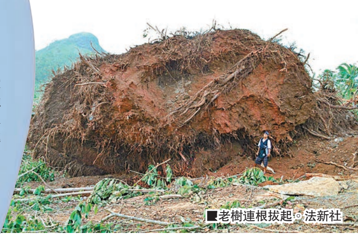
■老樹連根拔起。