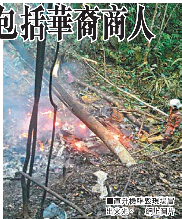
■直升機墜毀現場冒出火光。網上圖片