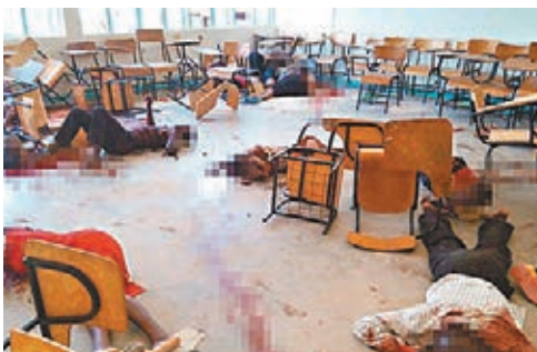
■大學課室內有大批學生遇害。網上圖片

肯尼亞東部城市加里薩大學上週四發生校園恐襲案，造成148人死亡，內政部長尼凱瑟利昨日透露當局已拘捕5名涉案人士。聲稱發動襲擊的「索馬里青年黨」則發聲明，表示襲擊只針對非穆斯林，又揚言會捲土重來。