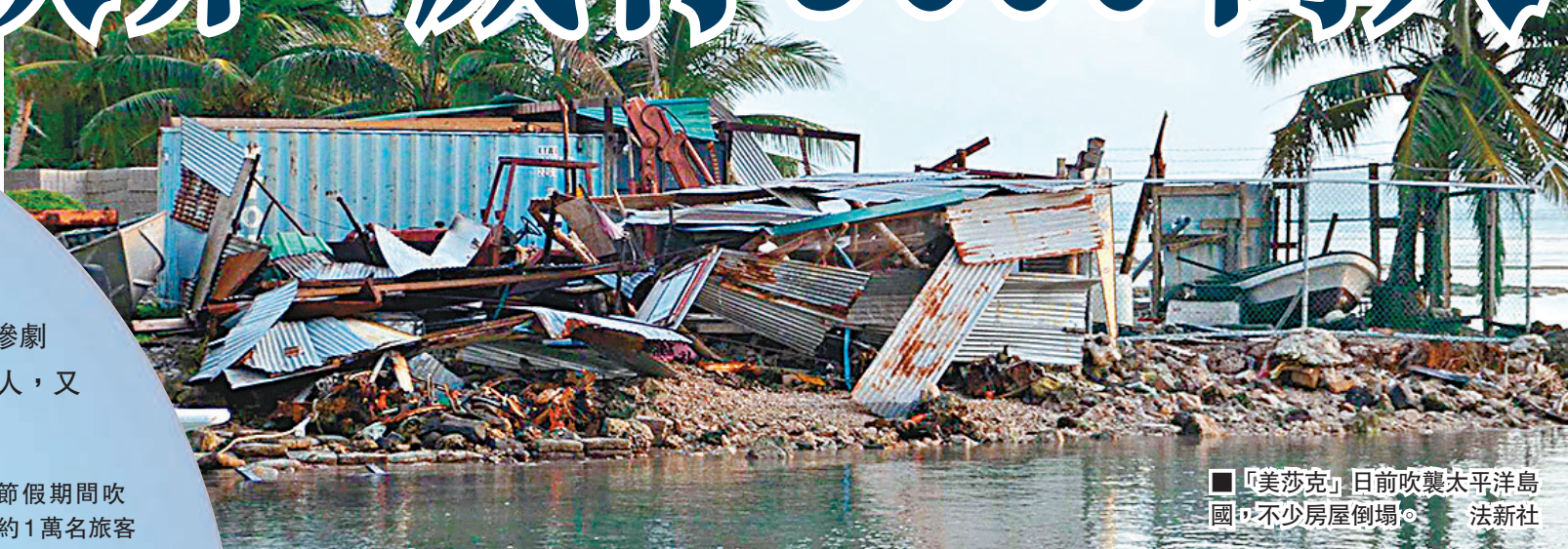
■「美莎克」日前吹襲太平洋島國，不少房屋倒塌。