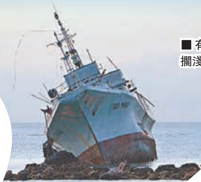
■有船隻被吹擱淺。法新社

比處處於重建核心的沿岸地區災民，內陸災民情況更差，不少人至今仍住在臨時房屋，負擔不起遷入更堅固的房屋。原定用作疏散安置的中心遲遲未施工，部分地方更變成興建私人住宅。較令人樂觀的或許只是「海燕」令民眾提高警覺性提高，在風災來臨時提早疏散往安全地區。 ■《衛報》