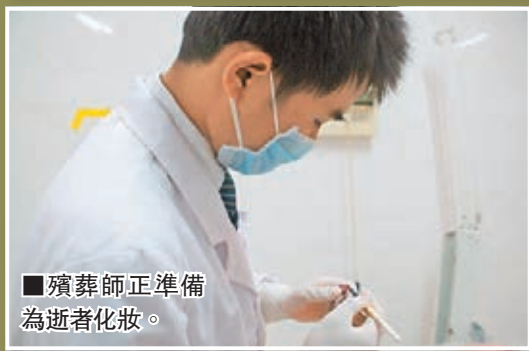
■殯葬師正準備為逝者化妝。