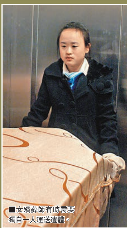
■女殯葬師有時需要獨自一人運送遺體。

還有四十多歲的男士，因事業變故跳樓自殺，年少的兒子再三請求殯葬師讓他看爸爸最後一眼，掀開白布，慈愛的父親血肉模糊，兒子說他不害怕，只是不知道怎麼適應沒有父親的日子。