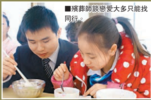
■殯葬師談戀愛大多只能找同行。