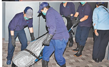
■被巴士撞死老翁遺體被移離醫院。

香港文匯報訊(記者 杜法祖)馬鞍山烏溪沙巴士總站發生致命車禍。一輛雙層九巴在站內讓路位，突將一名橫過馬路的八旬老翁撞倒頭部重創昏迷，送院搶救無效證實死亡。警方事後拘捕涉嫌危險駕駛的男車長扣查，目前正循司機駕駛態度及車速等方面調查原因。有區議員指，該巴士站設計存在三大問題，包括巴士車速過快及未有足夠的安全設施等，望當局正視。