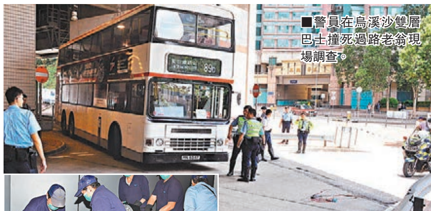
■警員在烏溪沙雙層巴士撞死過路老翁現場調查。