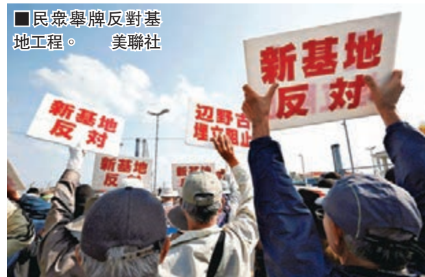
民眾舉牌反對基地工程。