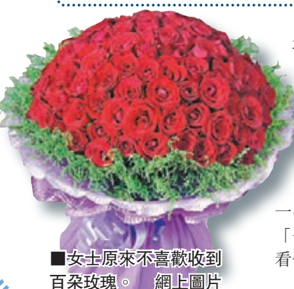
女士原來不喜歡收到百朵玫瑰。