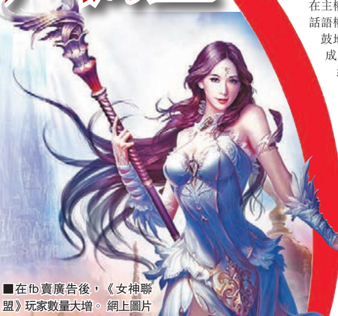
在fb賣廣告後，《女神聯盟》玩家數量大增。