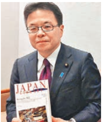
其中一本翻譯成英文版的日本文書。

日本首相安倍晉三上任後，大打國際輿論公關戰，積極向西方國家宣揚日本的觀點，試圖與中韓兩國在主權及歷史爭議問題上，搶奪話語權。安倍政府最近便密鑰緊鼓地日本文學小說類書籍翻譯成英文，並將英文版免費送給美國多間圖書館，讓西方輿論及公眾人士透過書籍認識日本。