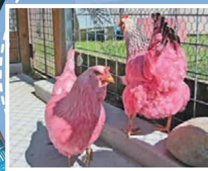
兩隻染成粉紅色的雞極速走紅。