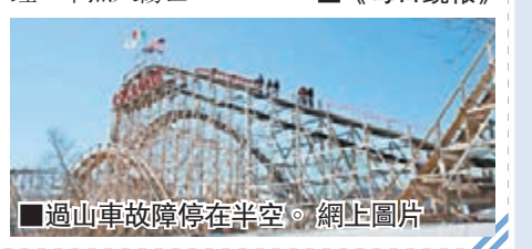
過山車故障停在半空。