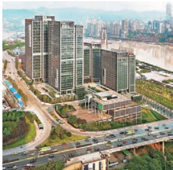
重慶兩江新區成立以來發展迅速。 本報重慶傳真

動把握投資新機遇。僅2014年一年,兩江新區實到外資44.67億美元中,來源於香港的有24.88億美元,佔55.7%。隨着重慶兩江新區保稅、金融、會展、訊息等開放型平台不斷完善,港資投資方向呈現多元特點,借鑑香港金融業的經驗,兩江新區建設長江上游金融中心。港資與兩江金融公司已達成合作意向,拓展兩江新區金融業全牌照戰略佈局;注資明德小額貸款,成為支持實體經濟發展、促進民間金融「陽光化」鏈條上的重要一環;投資兩江機器人融資租賃,幫助裝備製造業向服務轉型。同時看中兩江新區搶抓「一帶一路」及「長江經濟帶」戰略,建設國際物流樞紐的重要機遇,一批港資物流企業踴躍入駐,代表企業有嘉慧倉儲、豐江倉儲和普慶倉儲等。