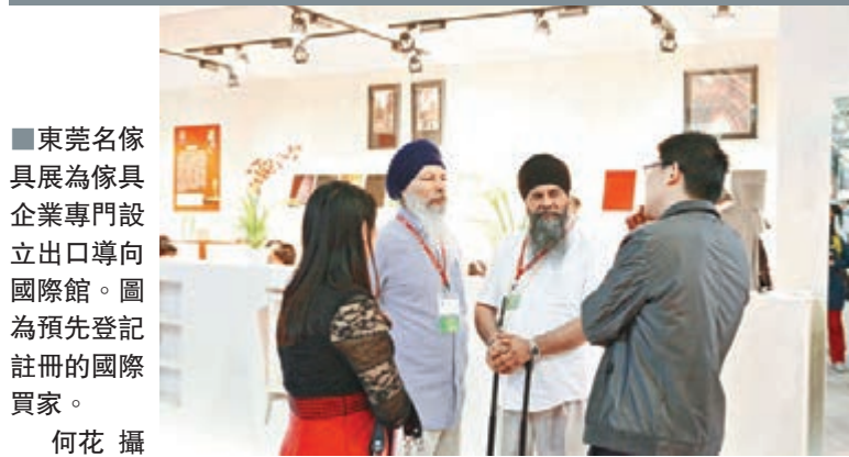
東莞名傢具展為傢具企業專門設立出口導向國際館。圖為預先登記註冊的國際買家。

香港文匯報訊(記者 何花 東莞報導)第33屆國際名傢具(東莞)展覽會日前在東莞厚街鎮國際展覽中心開幕,主辦方指本次展覽會吸引來自國內外1,306家傢具企業參展。本屆名傢具展啟用新建的3G館,包括「展覽一體化」核心項目名家居世博園(9號館)等在內,共十座展館,77萬平米。本屆展覽會專門設立出口導向國際館,幫助傢具企業拓展外銷市場。