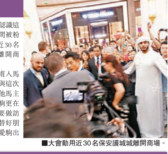
大會動用近30名保安護城城離開商場。

香港文匯報訊 郭富城日前以LONGINES代辦人之身份，遠赴杜拜出席世界盃賽馬盛事。在前往馬場之前，城城特地前往全球最大商場的Dubai Mall參觀，城城表示：「聽說商場有約50個足球場般大，當然要去看看！過去在亞洲不同地方城市看到自己的大型廣告版較多，但在杜拜看到自己的廣告牌，感覺特別新鮮，也很開心。」 他又去了參觀品牌在商場內舉行的展覽，更在海報上簽名。城城魅力驚人，在杜拜也有不少粉絲，除亞洲歌迷外，杜拜的居民亦到場一睹城城風采，他們表示從一些電影及演唱會DVD認識這位亞洲天王，所以整個商場一時間被粉絲擠得水洩不通，大會亦動用了近30名杜拜保安，才開出通道給城城離開商場。 城城旋即前往杜拜馬場，而他甫入馬場，亦被不少粉絲爭相集郵。參與這次盛事的還包括奧雲、洪金寶和其他馬主及練馬師朋友，特別是奧雲的愛駒更在第3場贏了冠軍，可惜當時城城要做訪問，不能親自前往恭賀他，但也替好朋友高興。他希望將來有機會亦帶愛駒出席國際賽事。