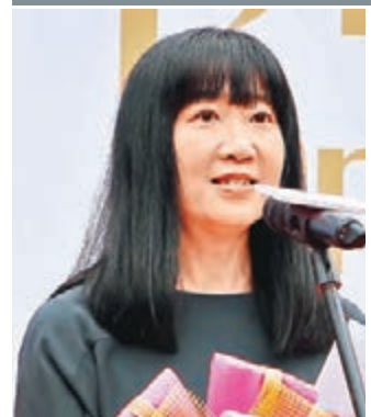
香港貿易發展局總裁方舜文在開幕儀式上致辭。