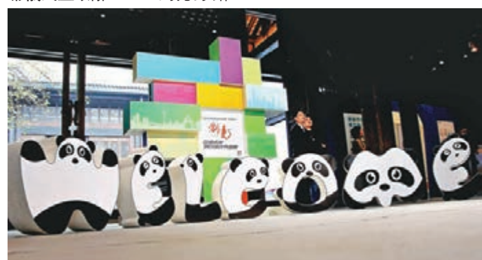
「創·見」蓉港青年創業設計作品展。