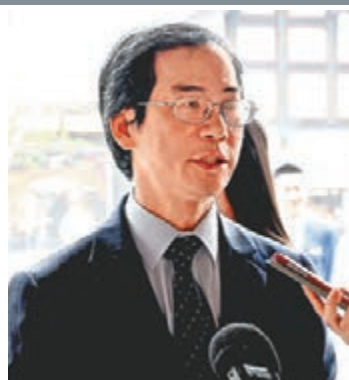
香港特區政府駐成都經貿辦事處主任劉錦泉接受記者採訪。