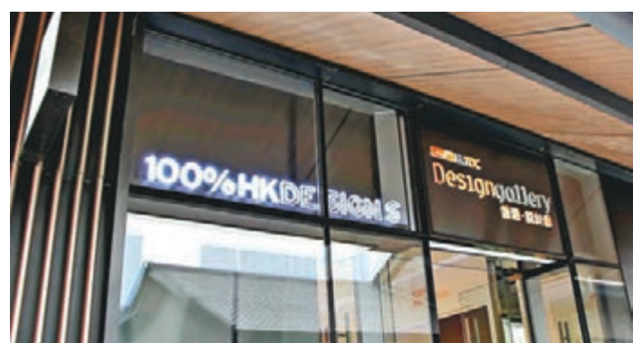
入駐成都遠洋太古里的「香港·設計廊」。

香港文匯報訊(記者周盼、實習記者劉亮荀 成都報道)27日，由四川成都市人民政府外事僑務(港澳事務)辦公室、香港貿易發展局、香港特區政府駐成都經貿辦事處等共同主辦的「2015蓉港創意設計交流季」活動在成都正式拉開帷幕。此次活動旨在進一步搭建成都與香港文化創意產業交流合作的平台，期間包括有香港設計廊成都店開幕儀式、「創·見」蓉港青年創業設計作品展、「品味成都」蓉港青年學生創意設計作品大賽以及蓉港創意設計作品兩地巡展交流四大主題。