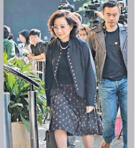
行政長官夫人梁唐青儀。