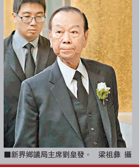
新界鄉議局主席劉皇發。