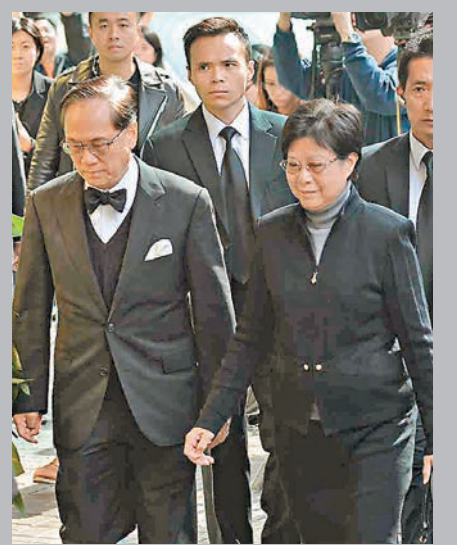
前特首曾蔭權伉儷。

董建華續指，邱德根一生反映香港的時代發展，見證香港由一個貧困及動盪的社會，經歷多次政治及金融風暴，透過發展工業走向繁榮，發展為國際金融中心。他在到此中向邱德根家人致以最衷心慰問。