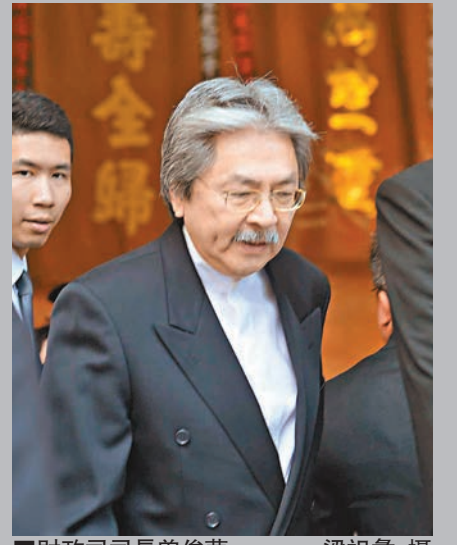
財政司司長曾俊華。