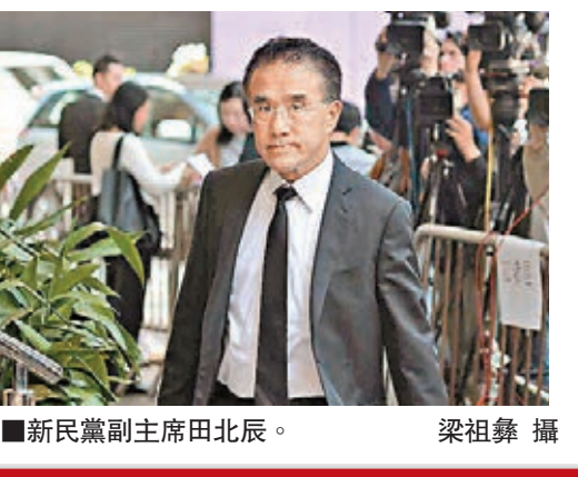
新民黨副主席田北辰。