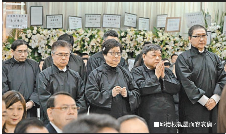
邱德根親屬面容哀傷。