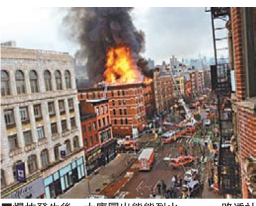
爆炸發生後，大廈冒出熊熊烈火。