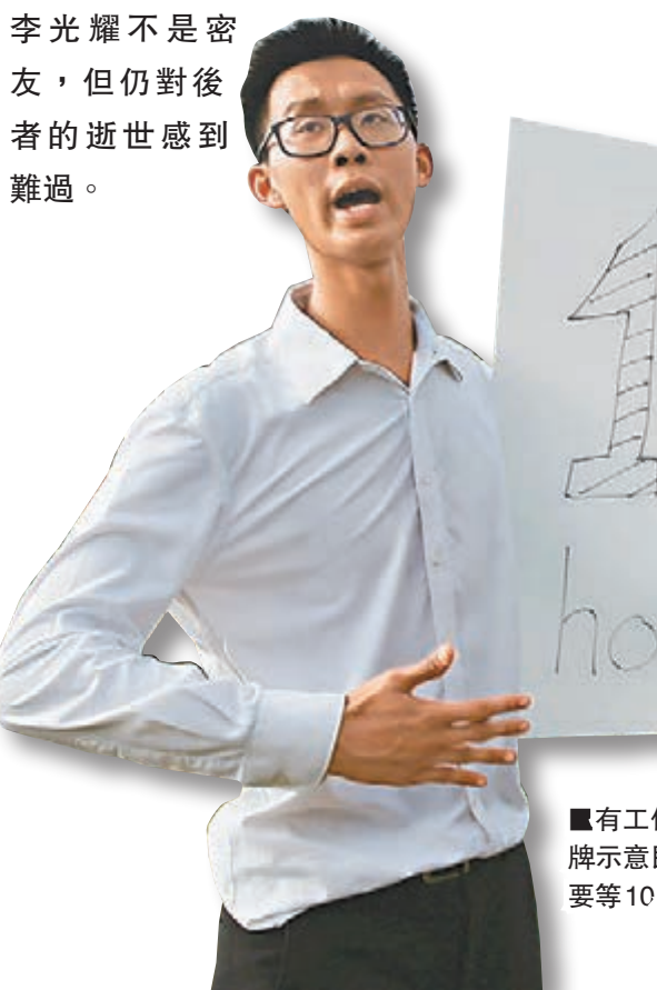
有工作人員舉牌示意民眾排隊要等10小時。