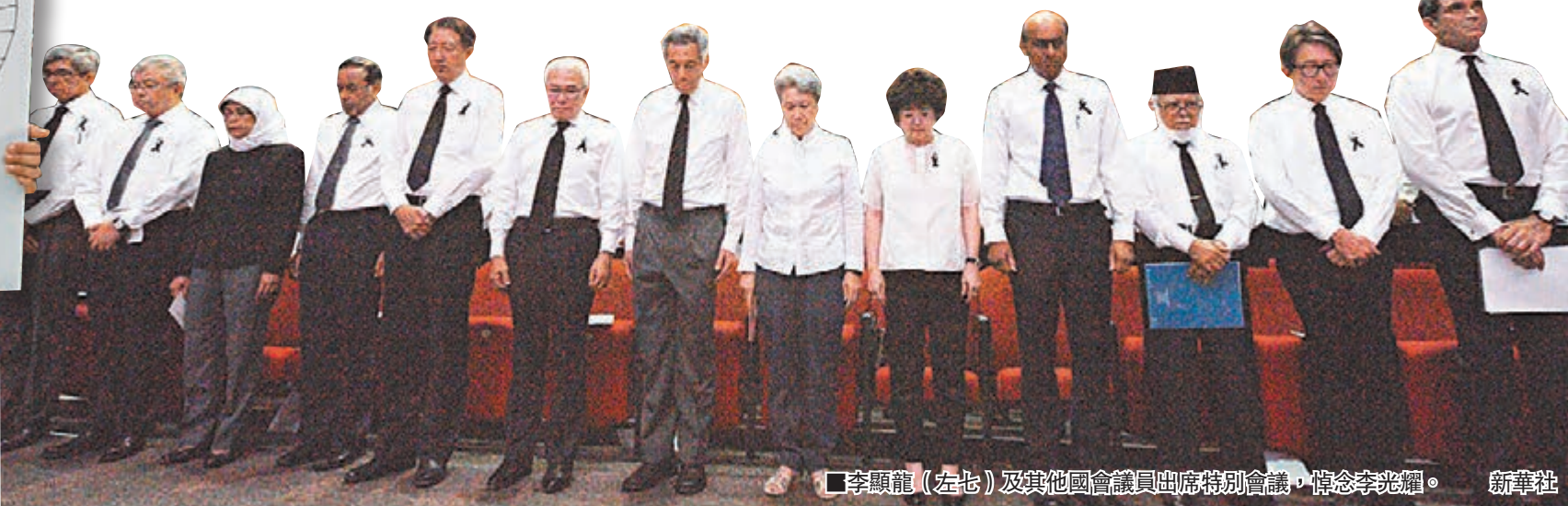
李顯龍(左七)及其他國會議員出席特別會議，悼念李光耀。