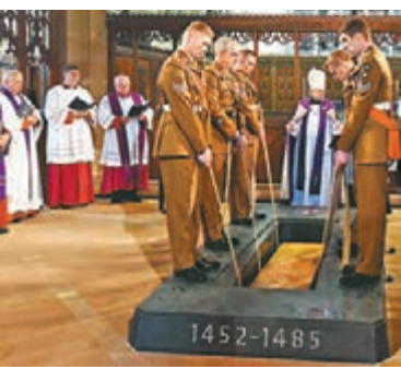
理查三世的安葬儀式。