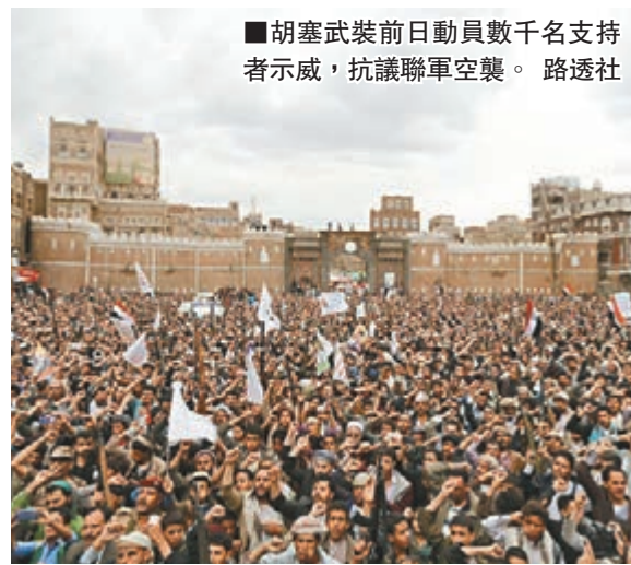
胡塞武裝前日動員數千名支持者示威，抗議聯軍空襲。