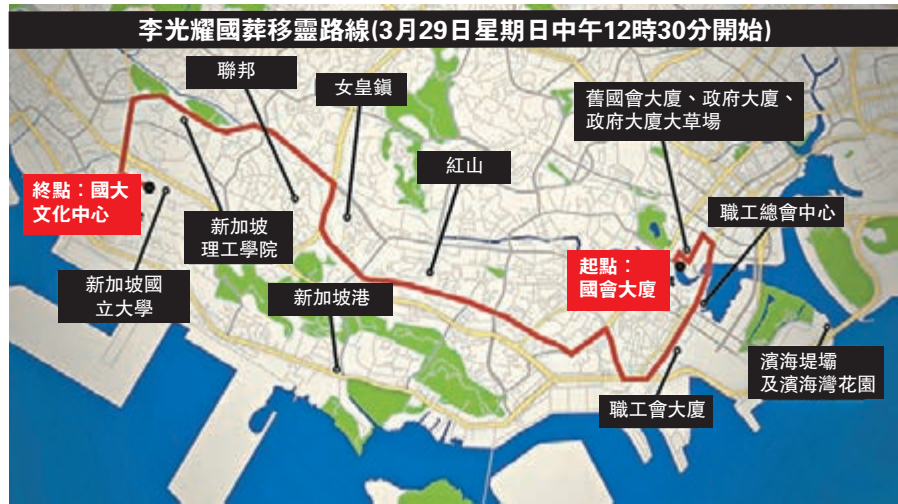
李光耀國葬移靈路線(3月29日星期日中午12時30分開始)

香港文匯報訊(記者 李自明)新加坡建國總理李光耀國葬儀式將於明日舉行，特區政府發言人昨日表示，前任行政長官董建華將代表特首及香港特別行政區政府，前赴新加坡出席李光耀的國葬。