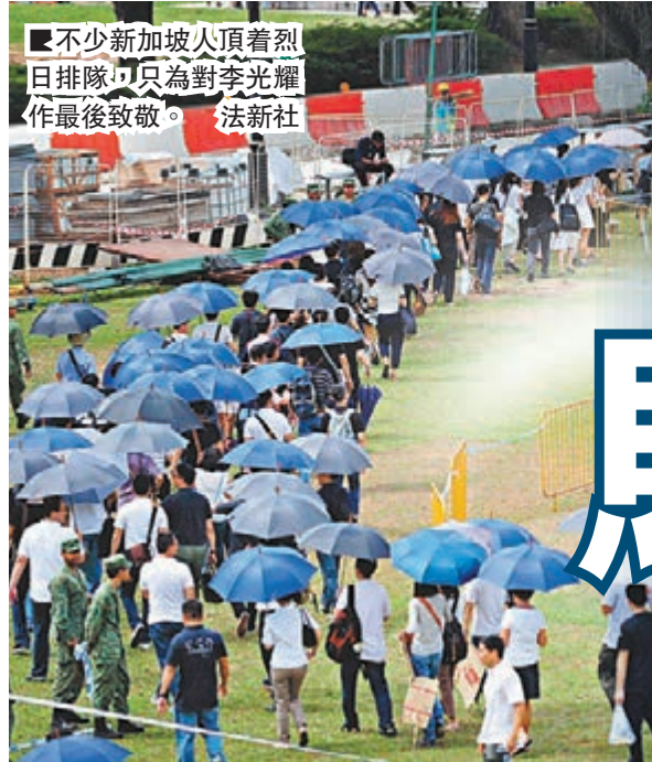
不少新加坡人頂着烈日排隊，只為對李光耀作最後致敬。