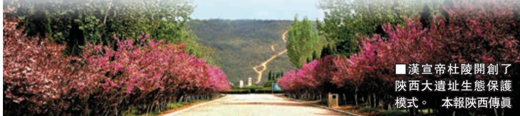
漢宣帝杜陵開創了陝西大遺址生態保護模式。本報陝西傳真

位於陝西省禮泉縣城西北22.5公里九峻山上的唐太宗昭陵，是「唐十八陵」中規模最大的一座。唐太宗是中國歷史上最偉大的帝王之一，昭陵也開創了「依山為陵」的先河。昭陵陪葬墓群極其龐大，數量眾多，是唐陵中的代表。而陝西乾縣的乾陵則為中國歷史上唯一女皇帝武則天與丈夫唐高宗的合葬墓，走在乾陵景區，司馬道、石刻像、碑刻都十分宏大，大唐盛世氣息可見一斑。