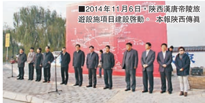
2014年11月6日，陝西漢唐帝陵旅遊設施項目建設啟動。本報陝西傳真

時隔千年，昔日的漢唐帝王陵在歷史長河中雄風不再，他們散落在關中平原的田間地頭，靜態地展現着歷史。如何讓躺在廣闊大地上的文物展示其活力，陝西省副省長白阿瑩曾多次提出，要堅持「一村護一陵，一陵帶一村」的發展方式，在保護文物的基礎上，將旅遊與當地經濟發展和群眾增收致富緊密結合，調動各區縣和當地群眾的積極性，促進帝陵周邊區域協同發展。