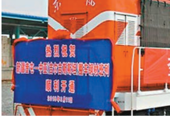
奎屯開往吉爾吉斯斯坦的鋼材班列。

香港文匯報訊(記者 馬晶晶 新疆報導)新疆烏魯木齊—中亞西行國際貨運班列(下稱「西行班列」)於3月開行滿一年，形成了新疆本地採購、內地貨物在烏魯木齊中轉出口的新格局。記者從自治區經信委獲悉，目前「西行班列」發展規劃正在編制中，計劃開行新疆至伊朗、土耳其和俄羅斯等地的貨運班列。此外，新疆還將構築3條快捷國際通道：中歐鐵路北通道、南通道和中通道，建設兩個國家中歐班列中轉集結中心，打造通往歐洲、中亞、西亞的國際物流通道。