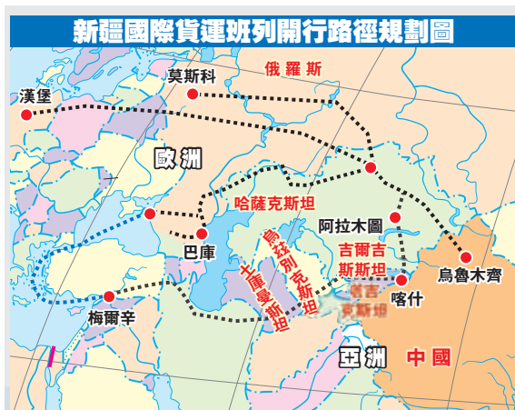
新疆國際貨運班列開行路徑規劃圖