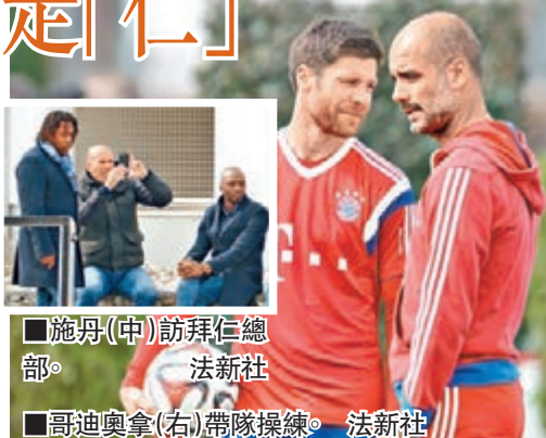
施丹(中)訪拜仁總部。法新社