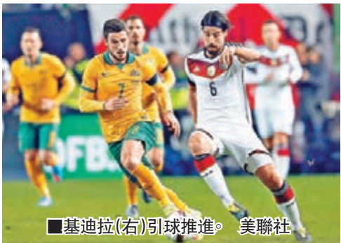
基迪拉(右)引球推進。