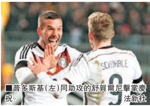
普多斯基(左)同助攻的舒賀爾尼擊掌慶祝。