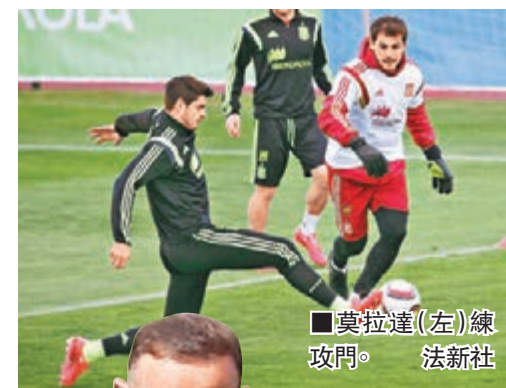
莫拉達(左)練攻門。