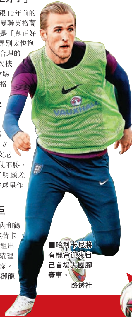
哈利卡尼將有機會迎來自己首場大國腳賽事。