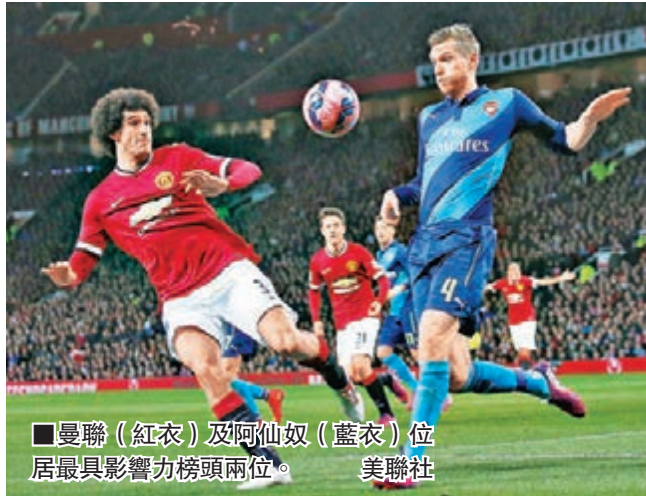
曼聯(紅衣)及阿仙奴(藍衣)位居最具影響力榜頭兩位。

英國《每日郵報》近日統計入場觀眾人數、全球球迷數字、獎盃量、頂級聯賽平均最終排名、國腳數量、收入，分別列出排名，總計加起來得出積分(最低分者為最佳)，曼聯在觀眾、球迷、國腳量及收入都得到第1，以10分榮膺最具影響力的英格蘭足球會，排第2是19分的阿仙奴，利物浦、車路士及曼城分別以22、25及31分順列第3到第5名。