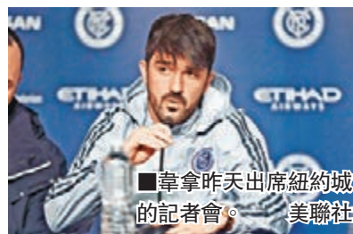
韋拿昨天出席紐約城的記者會。