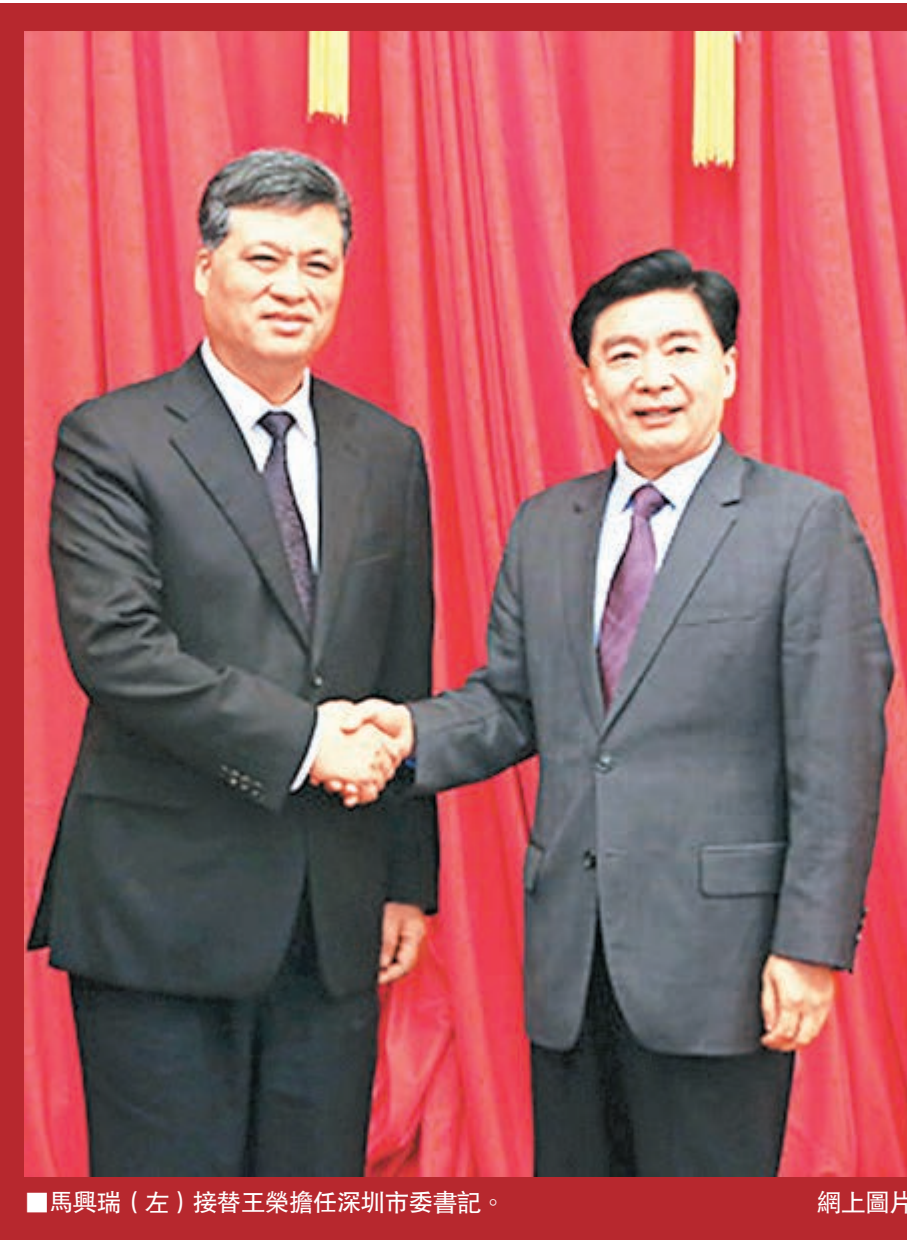
■馬興瑞(左)接替王榮擔任深圳市委書記。

翻看馬興瑞的履歷,似乎與香港沒有太多關聯,但有專家認為,目前深圳香港地位並不對等,在溝通協調方面有一定阻礙,馬興瑞兼任廣東省委副書記、政法委書記,亦是中央委員,層次較高,在推動深港溝通協調方面更能發揮作用。全國港澳研究會副會長、綜合開發研究院(中國深圳)常務副院長郭萬達表示,深港之間的合作領域日漸廣泛,尤其在經濟方面,香港經濟高度外向,而深圳的人才、產品供應鏈等有良好的基礎,也能提供很好的創業環境,與香港形成融合互補,當前兩地在前海蛇口自貿區建設、人民幣國際化等方面迫切需要實現更深度合作,新書記的重量級身份,應能進一步開拓局面,推動深港合作邁入新的時代。