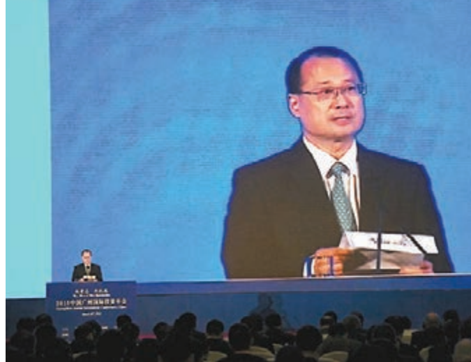
■蔡冠深出席廣州國際投資年會,倡導在南沙建設21世紀海上絲路經濟合作區。

「深度開放背景下的粵港金融合作與創新」主題分論壇上,嘉賓普遍認為,隨著「一帶一路」建設進展逐步提速,以及廣東自貿區戰略正式實施,粵港金融合作和廣州市金融產業發展都面臨新的歷史性機遇。