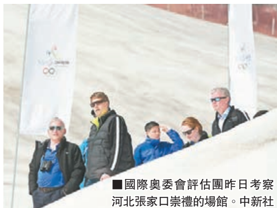
■國際奧委會評估團昨日考察河北張家口崇禮的場館。

香港文匯報訊(記者田一涵、張聰北京報道)國際奧委會評估團昨日在河北張家口賽區進行了實地考察,並聽取了有關張家口賽區場館規劃的主題陳述。北京冬奧申委向評估團介紹了張家口的申辦優勢,張家口賽區的緊湊佈局給評估團留下了深刻印象。至此,國際奧委會評估團在京張兩地所有的場館考察日程已經結束。