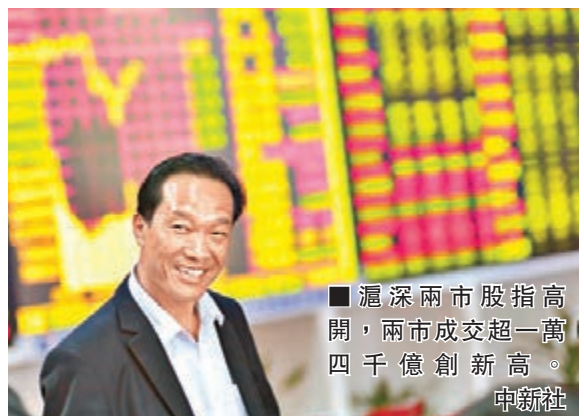
滬深兩市股指高開,兩市成交超一萬四千億創新高。

滬綜指在昨(前)日出現極為罕見的「九連陽」後,今(昨)早部分投資者獲利回吐,最多曾跌逾2%,但午後買盤又湧入,尾市抽上。滬綜指收市升3點或0.1%,收報3,691點,再創近7年新高;深證成指則升20點或0.16%,收報12,801點。翻查紀錄,滬綜指上次出現「十連陽」,已經是在近23年前的1992年。當年鄧小平南巡,力推經濟改革,激發市場情緒,滬綜指在1992年5月曾連升14日。