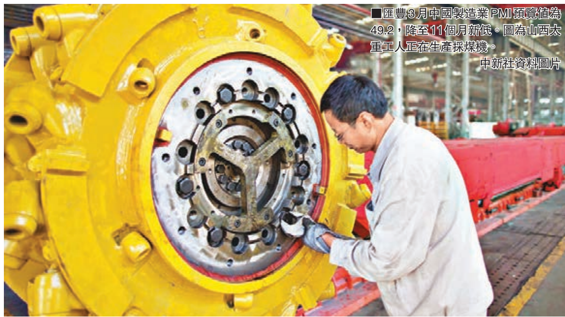
匯豐3月中國製造業PMI預覽值為49.2,降至11個月新低。圖為山西太原工人正在生產採煤機。

匯豐PMI數據顯示經濟下滑壓力繼續上升。分類指數中新出口訂單小幅回升則受益於歐洲經濟的復甦,但考慮到美國一季經濟走勢,出口對於GDP的貢獻不能高估。結合近期數據,估計一季中國GDP將跌破7%,二季度將成為中國寬鬆政策出台的密集期,貨幣、財政政策均將偏向積極,房地產銷售條件也有所放寬。並維持二季降息25個基點,以及通過MLF、PSL和2-3次全面降準的基礎貨幣投放量判斷。