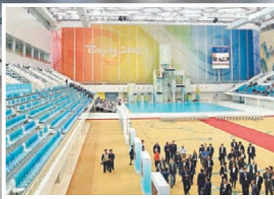
國際奧委會評估團考察「水立方」。

冬奧會擬2022年2月4日開幕 北京2022賽事安排和場館都以運動員為中心，致力於為所有冬奧會參與者提供一流的設施、精彩的賽事和非凡的體驗。冬奧會計劃於2022年2月4日開幕，2月20日閉幕，共設98枚金牌；冬殘奧會計劃於3月4日開幕，3月14日閉幕，共設72枚金牌。場館布局在北京、延慶、張家口三個賽區，賽區之間以高速公路、延慶公路等為紐帶實現三地之間快速抵達，場館之間提供專業化、人性化的交通服務。所有冰上項目在北京賽區舉行，所需的12個競賽和非競賽場館中，有11個來自北京2008年奧運會的場館遺產，昨日下午評估團對這些場館進行了實地考察。延慶和張家口賽區的競賽和非競賽場館最大程度地方便賽時使用和賽後利用，冬奧會後，這些場館將成為頂級冬季賽事舉辦地和市民享受高品質文化休閒生活的場所。