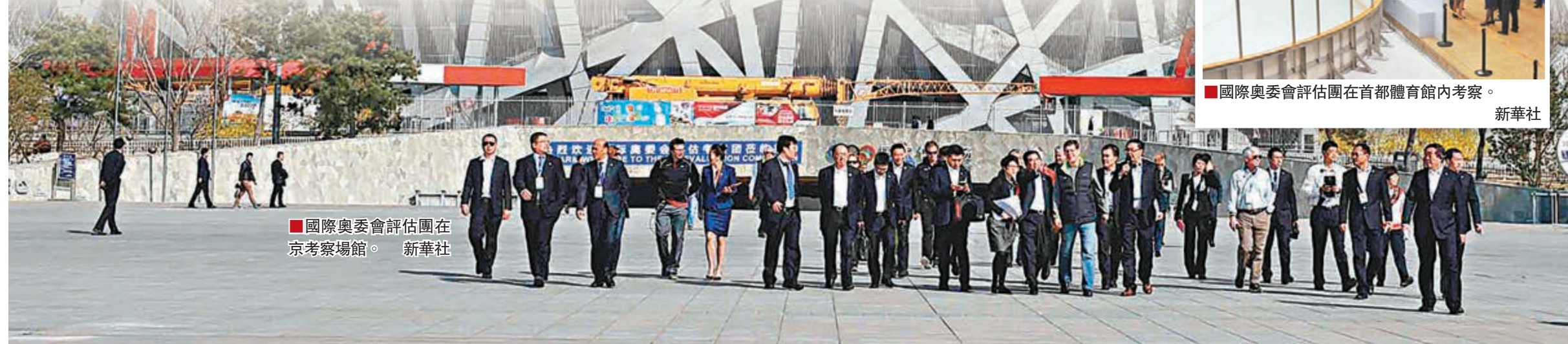
國際奧委會評估團在京考察場館。