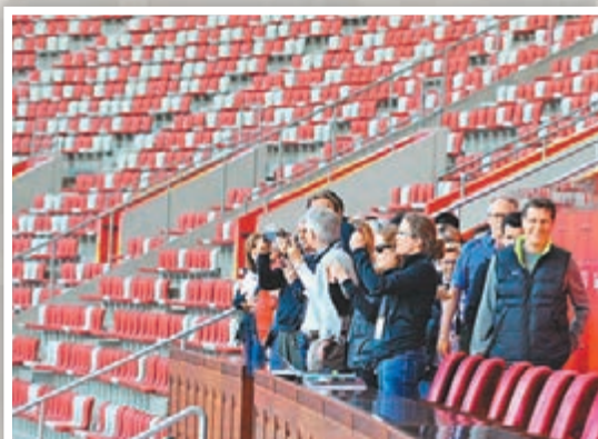
國際奧委會評估團考察國家體育場「鳥巢」。