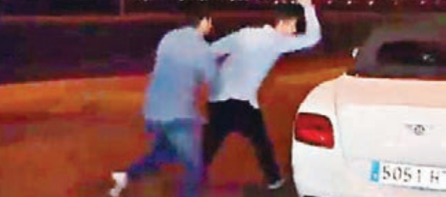
■球迷追打加里夫巴利的名車。

西班牙甲組足球聯賽馬德里首都雙雄命運各不同，其中上季帶領馬德里體育會一搵西甲18年聯賽冠軍之癢的44歲教頭施蒙尼昨晚同球會續約，由2017年延長到2020年，大大振奮球隊士氣。1998年世界盃令英格蘭「萬人迷」碧咸領紅牌的阿根廷前隊長施蒙尼退役後擔任教練，2011年底接掌馬體會，為球隊制定防守反擊的高效率戰術，奪得2012年歐霸盃後上季更於西甲封王，去年歐聯也是決賽飲恨。備受其他勁旅青睞的施蒙尼續約，為馬體會打下強心針。