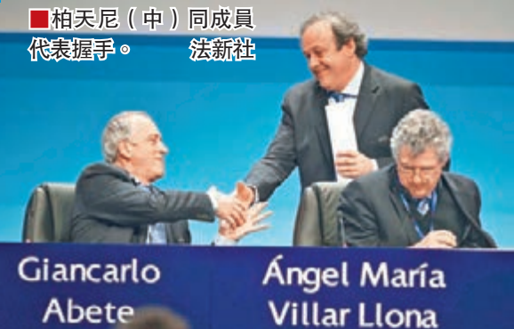
■柏天尼(中)同成員代表握手。

法國足球名宿柏天尼昨晚在歐洲足協大會上於沒有對手下連任，連續掌舵這個歐洲足球最高組織第3個任期，直到2019年。今年59歲的柏天尼2007年首度膺選歐足協主席，很多立場都同國際足協主席白禮達唱反調，其間亦作出了不少改革，例如在歐聯外圍賽及歐霸盃讓足球弱國或小國得到更多亮相