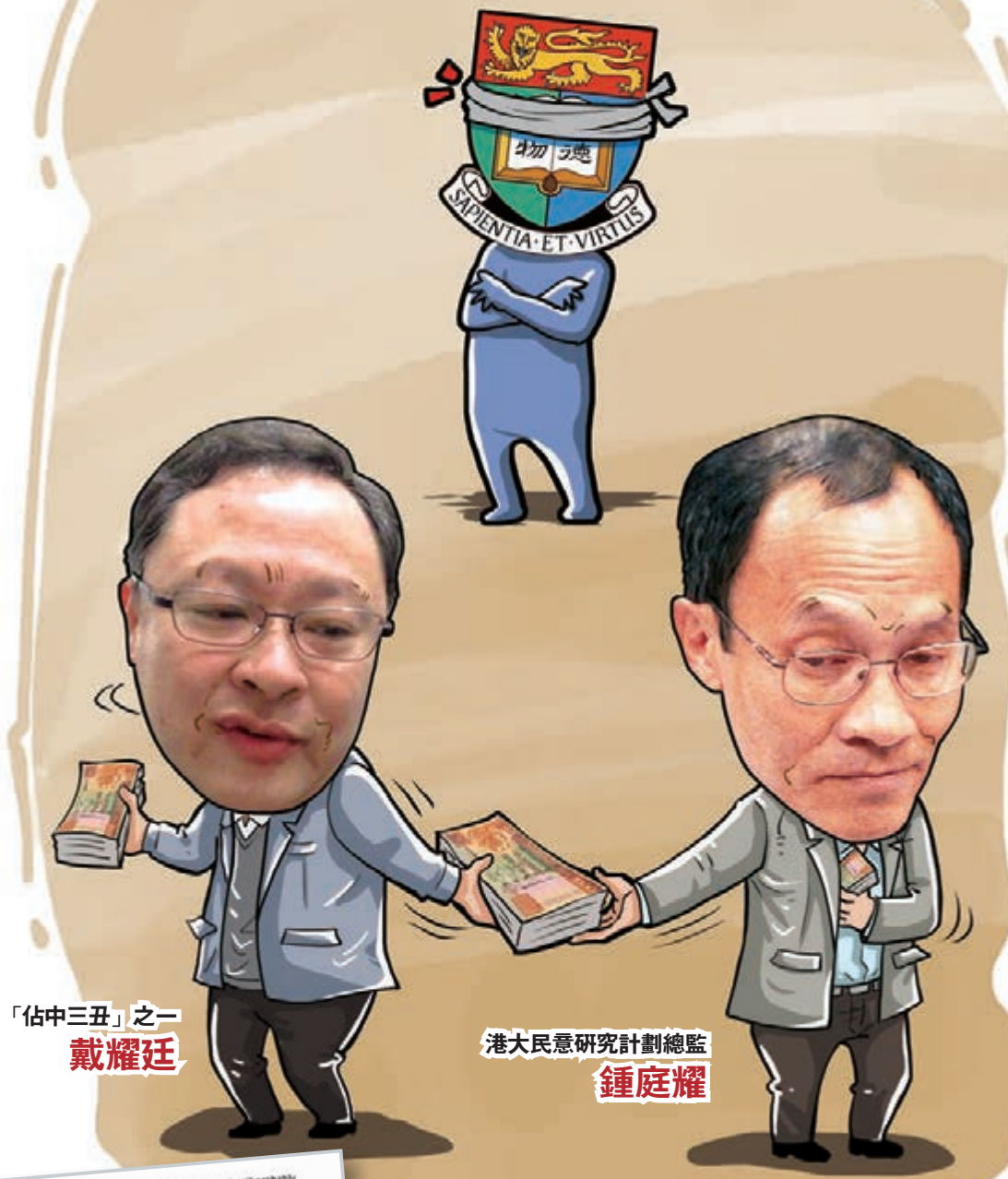
「佔中三丑」之一 戴耀廷