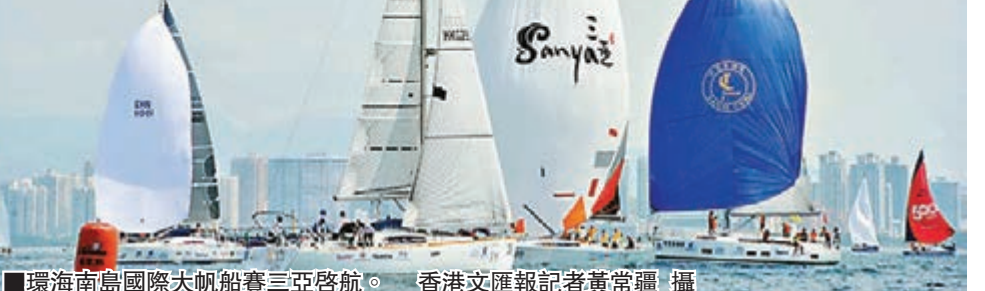
環海南島國際大帆船賽三亞啟航。

據悉，環海南島國際大帆船賽創辦於2010年，每年3月舉行，已成功舉辦四屆。2013年環海南島國際大帆船賽正式收入國際帆聯競賽目錄，成為國際帆聯系列賽中一項具有重要地位的環島賽事。該賽事由海南省政府和國家體育總局水上運動管理中心共同主辦，是國際旅遊島建設上升為國家戰略之後，海南傾力打造的大型國際品牌賽事。