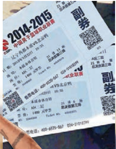
CBA總決賽第六場門票，印着「遼寧藥都本溪 VS 北京鴨」。網上圖片