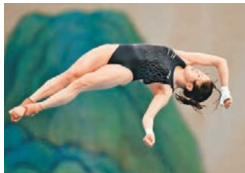
陳若琳在比賽中。