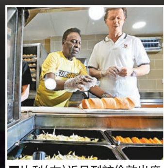
■比利(左)近日到訪倫敦出席宣傳活動，同前利物浦球星麥馬拿文學整三文治。