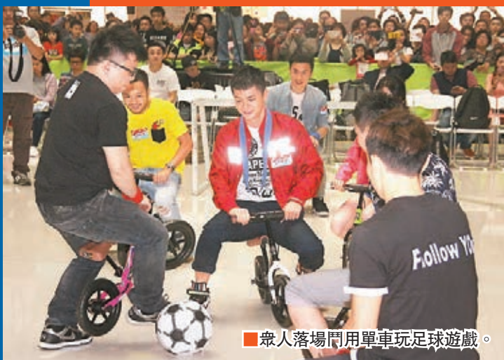
眾人落場門用單車玩足球遊戲。