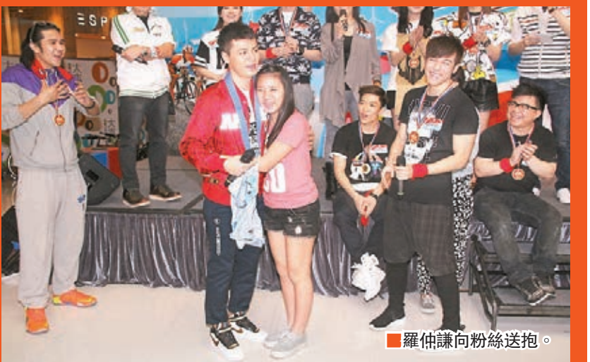
羅仲謙向粉絲送抱。