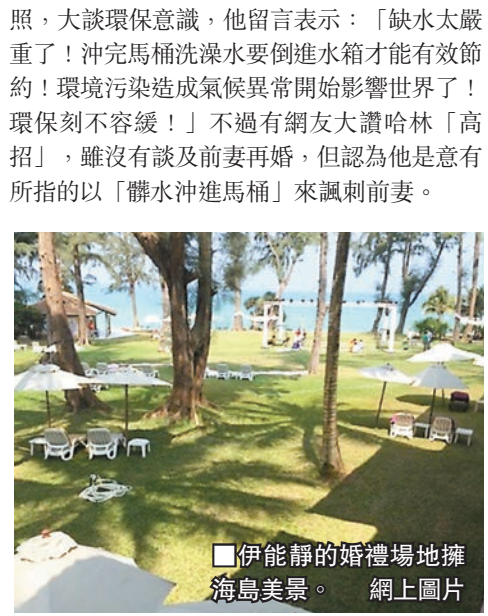
伊能靜的婚禮場地擁海島美景。網上圖片