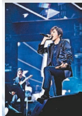
容和穿黑色服裝開場。