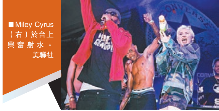
Miley Cyrus（右）於台上興奮射水。