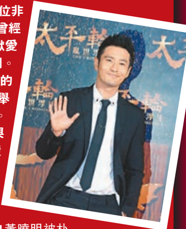
黃曉明被朴信惠大讚演技好。資料圖片