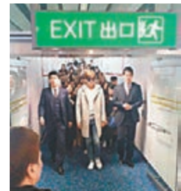
李敏鎬抵港，大批粉絲在禁區內跟蹤。

韓國男神李敏鎬昨日下午飛抵香港，準備今晚假亞洲國際博覽館舉行演唱會。他身穿杏色襯衫配牛仔褲，剛下飛機，單在禁區內已有近百名粉絲接機，場面虛囂，不少外國遊客也大感好奇。男神表現親切，不時向粉絲打招呼。當他步出VIP通道時，現場等候的約三百名粉絲即時歡呼聲四起，他亦十分識做，滿臉笑容，揮舞雙手打招呼，並接了一名粉絲的禮物後才離去。