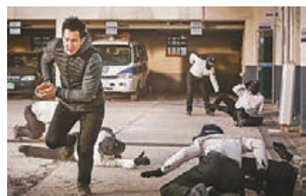
李政宰於片中有九成動作戲都是親身上陣。

韓星李政宰在新片《Big Match》中飾演拳手，42歲的他接拍這部片時曾遭親友反對，他亦感嘆自己年紀大，只是跑一下就氣喘如牛。李政宰在《Big Match》中幾乎是從頭打到尾，除了基本拳擊打鬥場面外，還有跑跳、飛奔及翻滾等戲分，以及從屋頂一躍而下的場面。