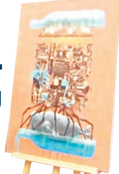
用作惡搞的平價畫。

影片分享網站YouTube賬戶lifehunterstv上載影片短短4日，已吸引近百萬人觀看。主持人將來宜家的畫作混入阿納姆現代藝術博物館的展品，邀請約20人參觀。主持人稱畫作出自瑞典畫家「IKEA Andrews」，然後邀請受訪者發表意見，一名男子大讚作品「結構豐富，每一層覆蓋在另一層之上，同時又包含在另一層之內」，另一名男子則讚畫家擁有「美麗的靈魂」。