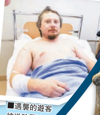
遇襲的遊客被送院醫治。