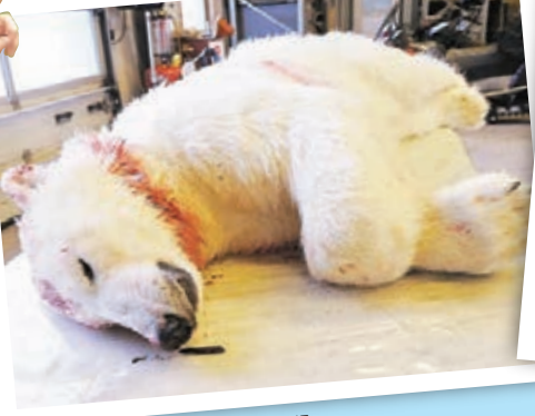
北極熊最終被射殺。