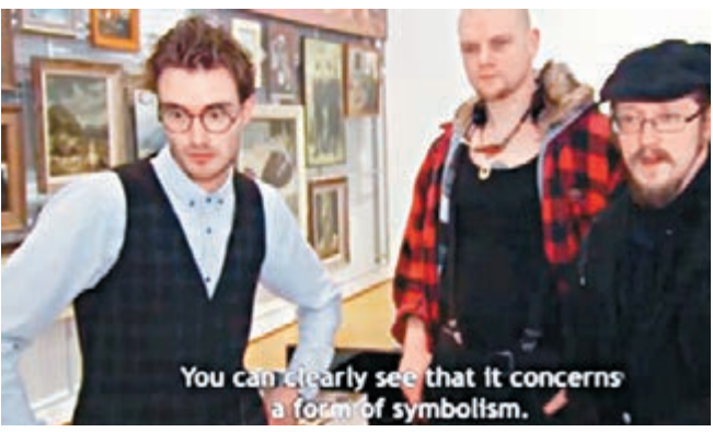
受訪者指畫作表現出象徵主義。網上圖片