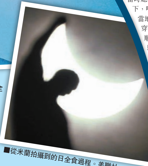
從米蘭拍攝到的日全食過程。

日全食形成戒指般的日冕現象，歐洲大部分地區天色短暫變黑。在法羅群島及瓦爾巴群島，能看見最高97%的日全食，旅客目擊過程時歡呼拍掌；50名丹麥天文愛好者更乘飛機在空中直擊。有遊客觀賞後直言被日全食震撼，驚嘆美不勝收，可惜太快結束。在西班牙、丹麥及英國，由於