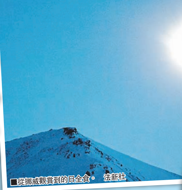
從挪威觀賞到的日全食。

歐洲昨日迎接全球今年唯一一次的日全食，大部分地區均可觀賞到長約3分鐘的日全食過程，包括西班牙、英國及瑞典，而在最佳觀賞地點北極圈附近的法羅群島及挪威斯瓦爾巴群島，則吸引約2萬名遊客到訪。一名捷克遊客前日在瓦爾巴群島等候觀看日食時，被北極熊闖入帳篷襲擊受輕傷。他的朋友當時朝北極熊開3槍將牠趕走，北極熊其後被救援人員開槍擊斃。