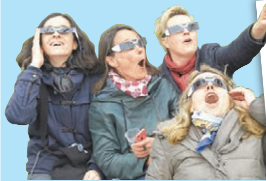
民眾見到日全食景象時，都表現得非常雀躍。