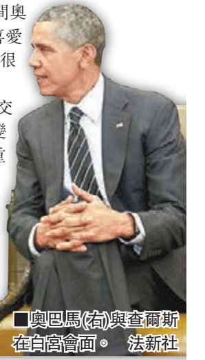
奧巴馬(右)與查爾斯在白宮會面。法新社

英國王儲查爾斯與妻子卡米拉前日繼續在美國親善訪問，到白宮與美國總統奧巴馬會晤，其間奧巴馬讚賞英國王室的影响力，笑稱美國民眾喜愛英國王室多於本土政治人物，查爾斯則表示「很高興聽到這說法」，但謙稱「我不信」。查爾斯伉儷今次4天訪美行程主打「文化交流」，白宮此行還將推動兩國應對氣候變化等領域的合作，凸顯英美特殊關係的重要性。奧巴馬在白宮橢圓形辦公室歡迎查爾斯伉儷，彼此言談甚歡，奧巴馬更告訴查爾斯：「美國人喜歡英國王室，遠勝過包括我在內的政治人物。」英國媒體認為，奧巴馬此言除了是客套話外，也反映出目前美國黨爭令民眾討厭政客。 法新社/中新社/路透社/《衛報》