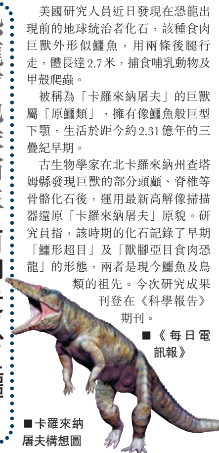
卡羅來納屠夫構想圖

美國研究人員近日發現在恐龍出現前的地球統治者化石，該種食肉巨獸外形似鱷魚，用兩條後腿行走，體長達2.7米，捕食哺乳動物及甲殼蟲。被稱為「卡羅來納屠夫」的巨獸屬「原鱷類」，擁有像鱷魚般巨型下顎，生活於距今約2.31億年的三疊紀早期。古生物學家在北卡羅來納州查塔姆縣發現巨獸的部分頭顱、脊椎等骨骼化石後，運用最新高解像掃描器還原「卡羅來納屠夫」原貌。研究員指，該時期的化石記錄了早期「鱷形超目」及「獸腳亞目食肉恐龍」的形態，兩者為現今鱷魚及鳥類的祖先。今次研究成果刊登在《科學報告》期刊。 《每日電訊報》