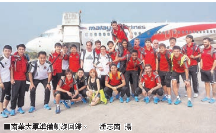
■南華大軍準備凱旋回歸。

在對彭亨一戰受傷的艾華，傷勢不輕，走路時左膝仍是一拐一拐，他表示明日對太陽飛馬料難以披甲。主教練馬里奧滿意球員是役的表現，對賽果更感到高興，只是艾華受傷，打亂了對太陽