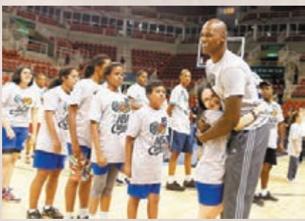
■夏寧頓(右)結束16年職業生涯。

曾兩度效力溜馬的前鋒夏寧頓周三宣布退役，正式結束16年職業籃球生涯。現年35歲的夏寧頓在1998年選秀大會上被溜馬首輪選中，效力至2004年後離隊，其後在2006/07年球季短暫回巢，NBA生涯中效力過溜馬、鷹隊、勇士、紐約人、金塊、魔術和巫師，平均每場取得13.5分和5.6個籃板球。去年8月，夏寧頓轉戰中國職業籃球聯賽(CBA)加盟福建建興，不過最後返回美國尋找落班機會。目前，夏寧頓獲金塊邀請協助球隊訓練直至球季結束。 ■記者 蔡明亮