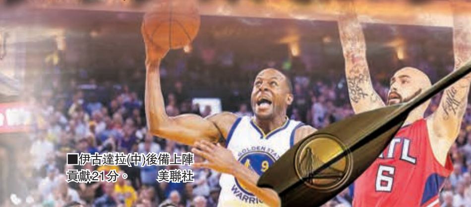
■伊古達拉(中)後備上陣貢獻21分。