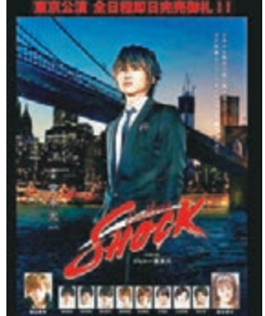
堂本光一最近忙於為舞台劇《Endless Shock》演出。

日本尊尼事務所組合Kinki Kids成員堂本光一昨日於東京帝國劇場演出舞台劇《Endless Shock》時發生意外,最終造成5名男演員及1名男工作人員受傷,演出被迫暫停,其中一人傷勢較重,而堂本光一及現場約二千名觀眾並無大礙。據悉,意外起因是舞台布景中約800公斤重的LED燈顯示器意外倒塌,目前有關人員正詳細調查事故原因,而原定昨晚6時公演的夜場亦宣布暫時取消,主辦單位將盡快公布退款事宜。