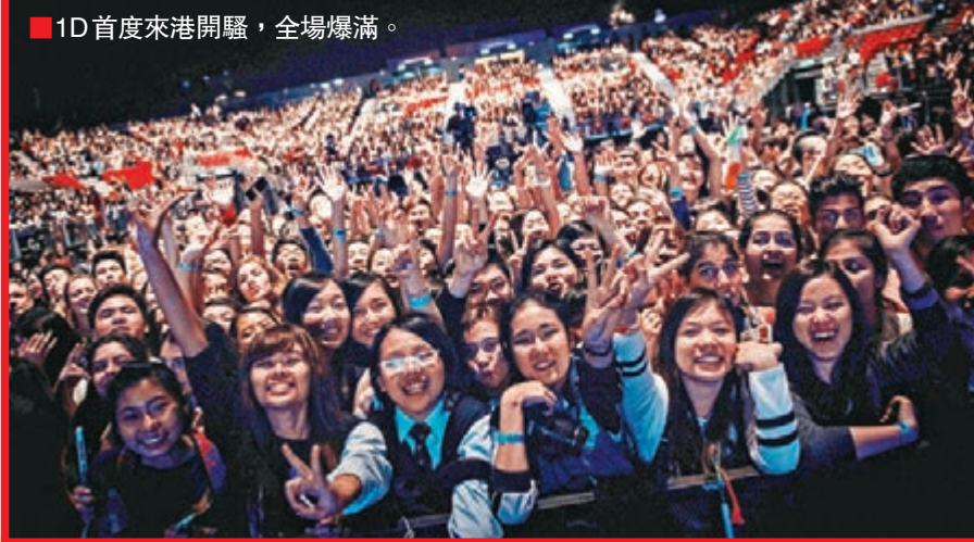
1D首度來港開騷,全場爆滿。