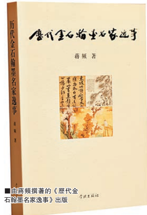
■由蔣頻撰著的《歷代金石翰墨名家逸事》出版