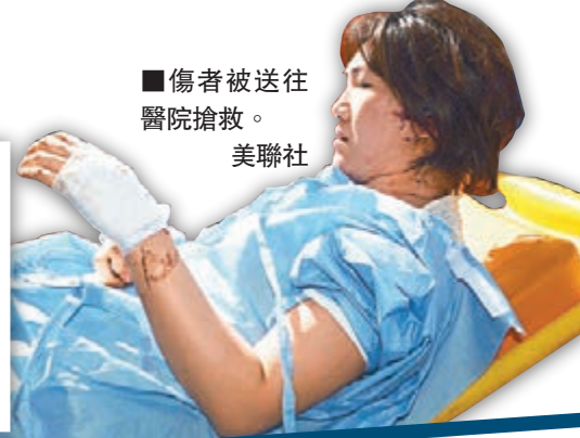
■傷者被送往醫院搶救。