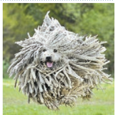
■《每日郵報》 ■匈牙利牧羊犬

匈牙利長毛牧羊犬的毛髮天生又長又亂，德國一名攝影師捕捉到一隻匈牙利牧羊犬在公園玩耍跳躍的一刻，好像一個散開的地拖頭。