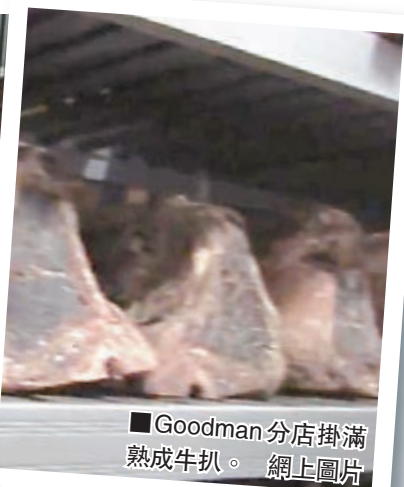
■Goodman分店掛滿熟成牛扒。網上圖片

烹煮牛扒不外乎燒烤煎焗，但歐美近年興起「熟成牛扒」，即是讓牛扒低溫風乾，使口感及味道昇至另一層次。知名跨國扒房Goodman的英國分店便推出熟成180天的頂級牛扒，每公斤售價為215英鎊(約2,480港元)，每客65英鎊(約751港元)，價格雖是一般肉店的10倍，仍吸引不少饕客搶訂品嚐。