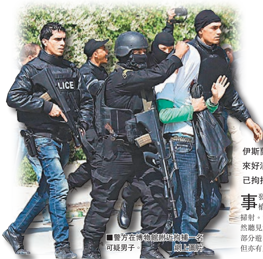
■警方在博物館附近拘捕一名可疑男子。