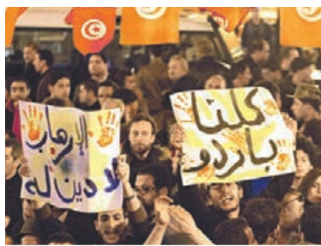
■大批突尼斯民眾前晚上街，悼念槍擊案中的死難者。美聯社