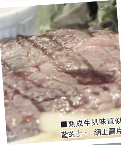
■熟成牛扒味道似藍芝士。