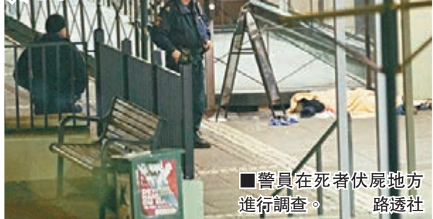
■警員在死者伏屍地方進行調查。