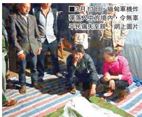
3月13日，緬甸軍機炸彈落入中方境內，令無辜平民痛失至親。網上圖片