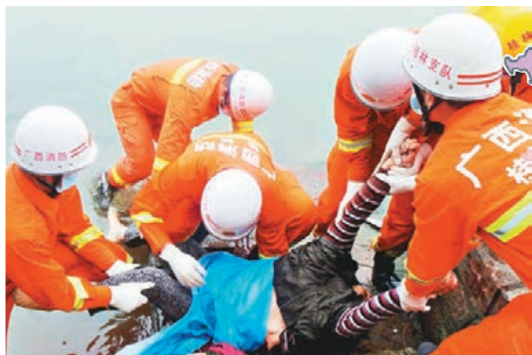
一名女遊客在景區碼頭被落石擊中身亡。落石砸在景區樓梯上，有倖存者稱當時人太擠，根本跑不了。