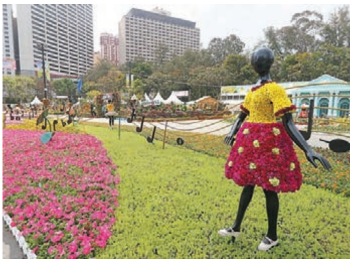
「花展配合「跳舞蘭」布置成女孩跳舞的花藝裝置。」

*14歲或以下兒童、60歲或以上長者、全日制學生、殘疾人士及其照管人(每名殘疾人士只可與一名照管人同享優惠) 資料提供:康文署 製表:袁楚雙