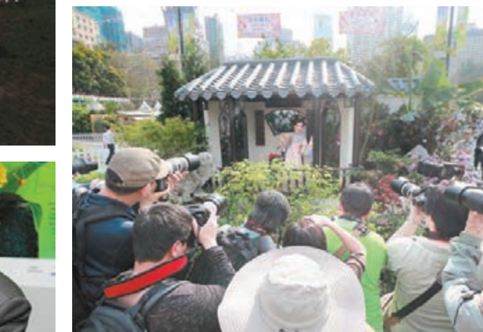
「現場安排與花爭妍的模特兒供一眾龍友拍照。」