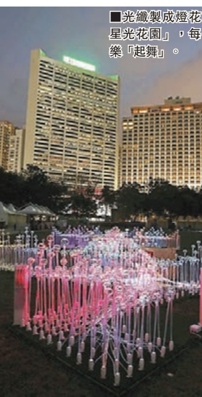
「光纖製成燈花的「幻彩星光花園」,每日傍晚配合「起舞」。」