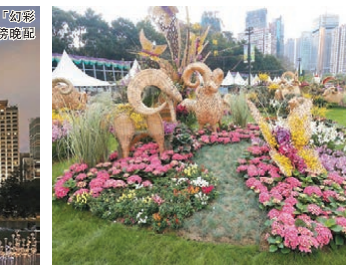
「花展特別設有羊形的花藝擺設迎合羊年。」