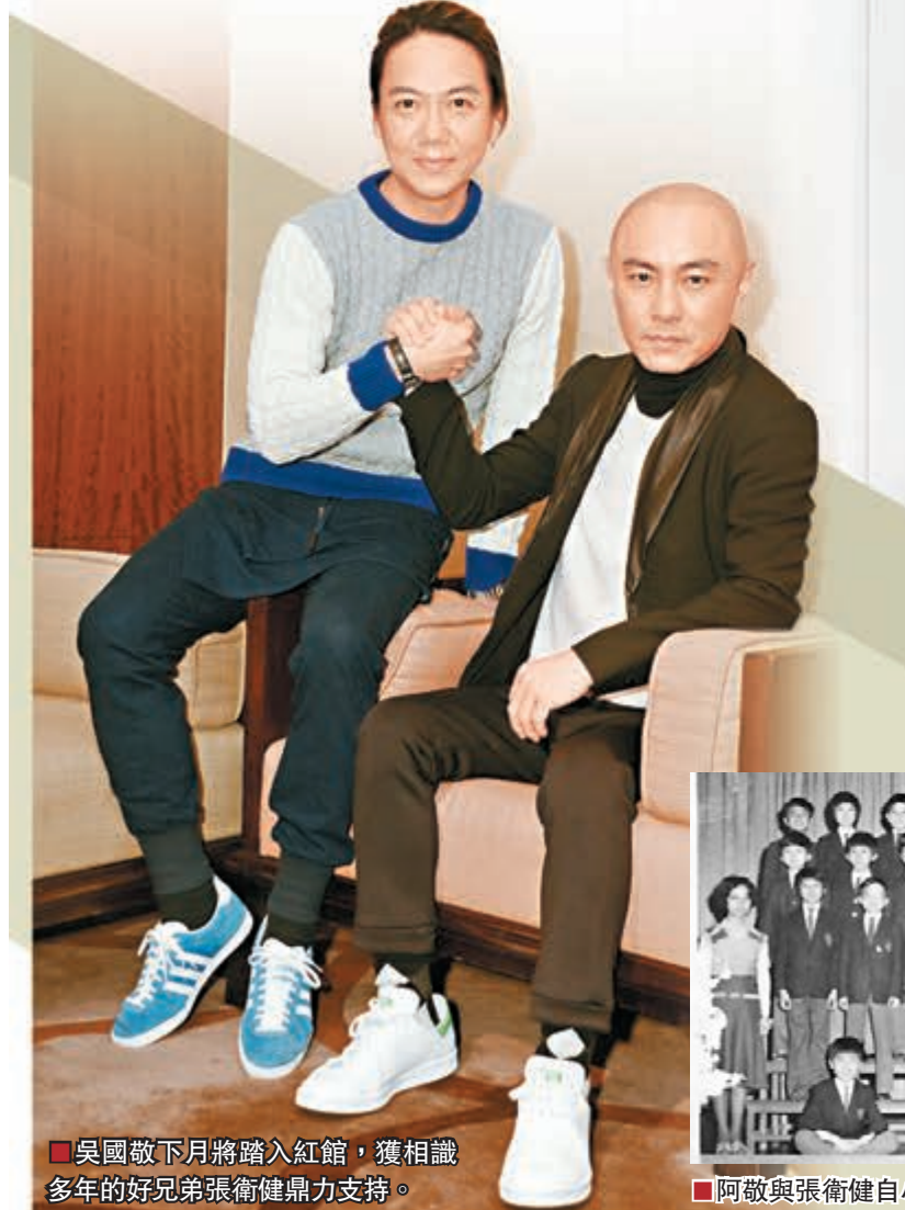
吳國敬下月將踏入紅館，獲相識多年的好兄弟張衛健鼎力支持。